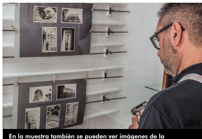
En la muestra también se pueden ver imágenes de la