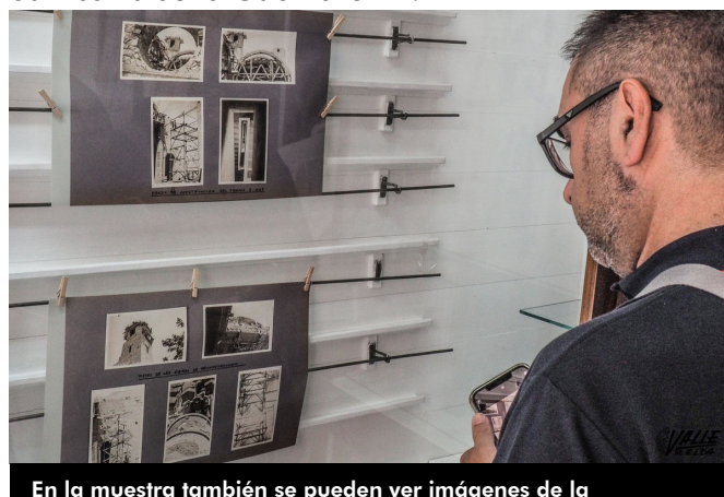
En la muestra también se pueden ver imágenes de la