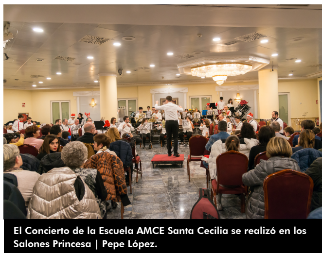
El Concierto de la Escuela AMCE Santa Cecilia se realizó en los Salones Princesa | Pepe López.

Los asistentes colaboraron con Cruz Roja entregando diferentes productos.