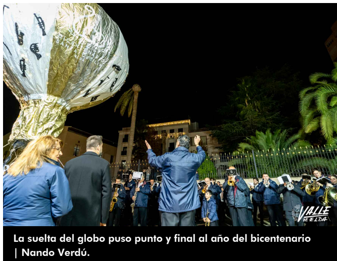
La suelta del globo puso punto y final al año del bicentenario