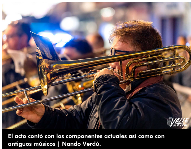
El acto contó con los componentes actuales así como con antiguos músicos | Nando Verdú.

Alrededor de las 18:30 horas la AMCE Santa Cecilia llegó a la plaza Antonio Porpetta, donde su presidente habló para todos los presentes recordando las 14 actividades que se han organizado a lo largo de este año para conmemorar el bicentenario. Mancera destacó que "con este desfile hemos puesto en valor lo más importante de este colectivo, los músicos. La AMCE Santa Cecilia ha cumplido los 200 años pero aún le queda mucha vida por delante ". Tras ello se interpretó Santa Cecilia de Elda y el himno de Valencia, y justo en este momento se realizó la suelta del globo poniendo fin al año del bicentenario.