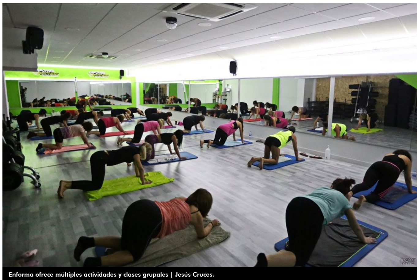
Enforma ofrece múltiples actividades y clases grupales

Enforma Fitness & Wellness Center es más que un gimnasio, es un centro equipado, ampliado y renovado con las máximas exigencias. El centro cuenta con el material adecuado para llevar a cabo una multitud de actividades de forma individual o en clases de grupo bajo la supervisión de un monitor.