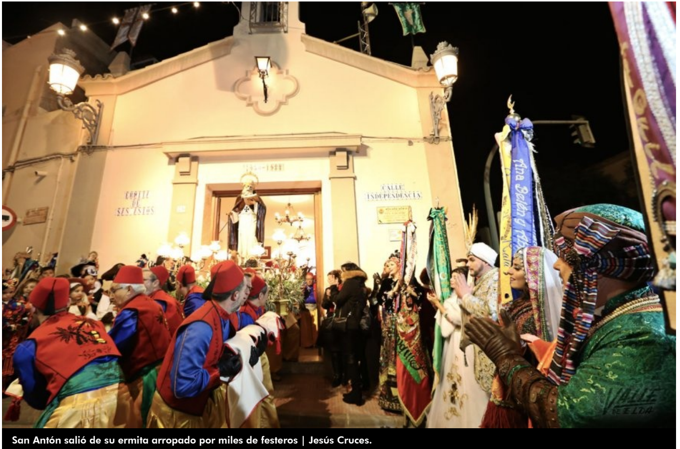
San Antón salió de su ermita arropado por miles de festeros | Jesús Cruces.

Los Moros y Cristianos en Elda se viven como algo que más que una fiesta . Miles de personas lo demostraron ayer al convertir el traslado de San Antón en un acto multitudinario , desde su ermita hasta Santa Ana, donde permanecerá menos de 24 horas. Las calles del centro de Elda y los cuartelillos se llenaron para celebrar que la ciudad ha llegado al ecuador de estas fiestas , que en 2018 se celebrarán del 7 al 11 de junio. La música, el colorido y el buen ambiente impregnaron de alegría cada rincón de Elda. Mientras que la mañana de ayer estaba enfocada al disfrute de los niños , en la tarde pequeños y mayores formaron sus escuadras y permitieron a la ciudad revivir las sensaciones del fin de semana más esperado por los festeros .