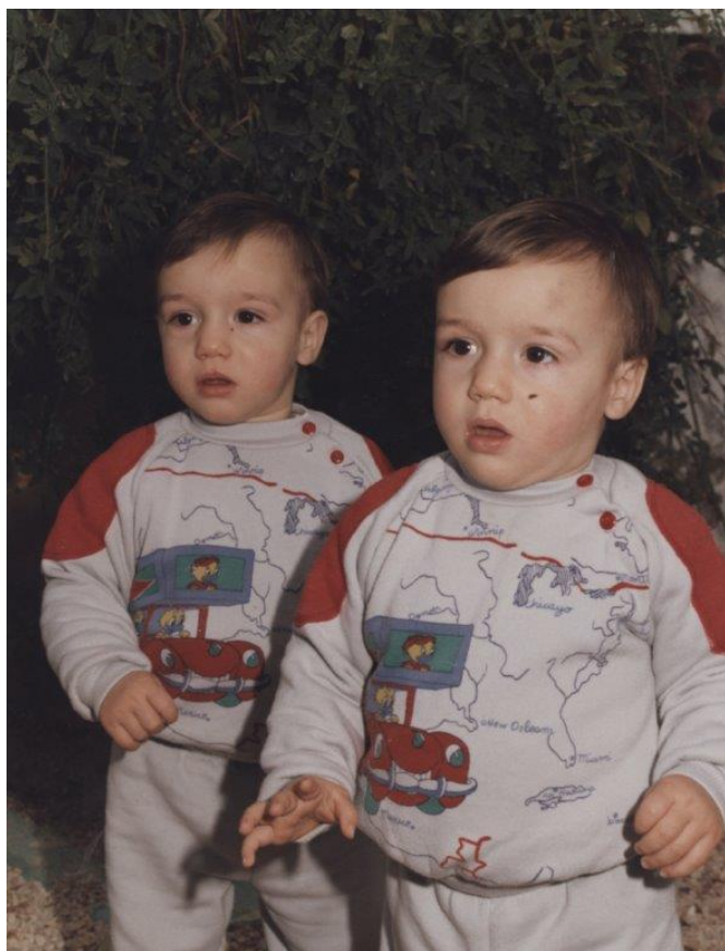
Los gemelos Guardiola Villaplana durante su primer día de guardería. Año 1985.

Grandes de tamaño, espíritu y corazón, sus pasos y pisadas crecieron entre su casa, el colegio, el polideportivo y la casa de su abuela Rosa, donde degustaban las succulentas comidas que les preparaba: tortillas de patatas, mondonguilles de abaecho y cómo no, paella.