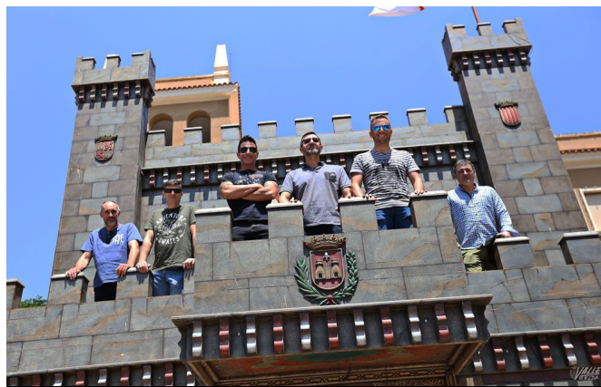
Los agentes desean unas felices fiestas al pueblo de Elda | Jesús Cruces.

También han querido recordar a la ciudadanía que "son días de fiesta y celebración, pero que tengan en cuenta que también hay ciudadanos que tienen derecho a descansar" por ello piden que se cumplan los horarios establecidos para el cierre de los cuartelillos, que son desde las 5 de la madrugada a 10 de la mañana, y que se utilicen los vehículos lo menos posible para evitar problemas de tráfico y de otra índole.