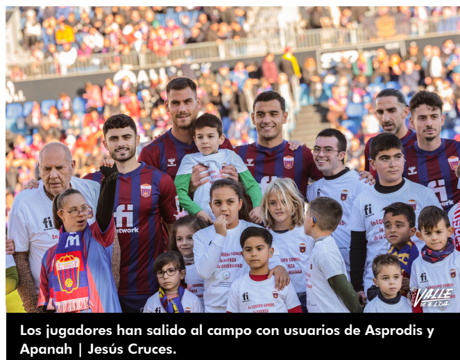
Los jugadores han salido al campo con usuarios de Asprodis y Apanah | Jesús Cruces.

igual que pasó en el partido ante el Sporting de Gijón el acierto no ha estado de cara para los azulgranas.