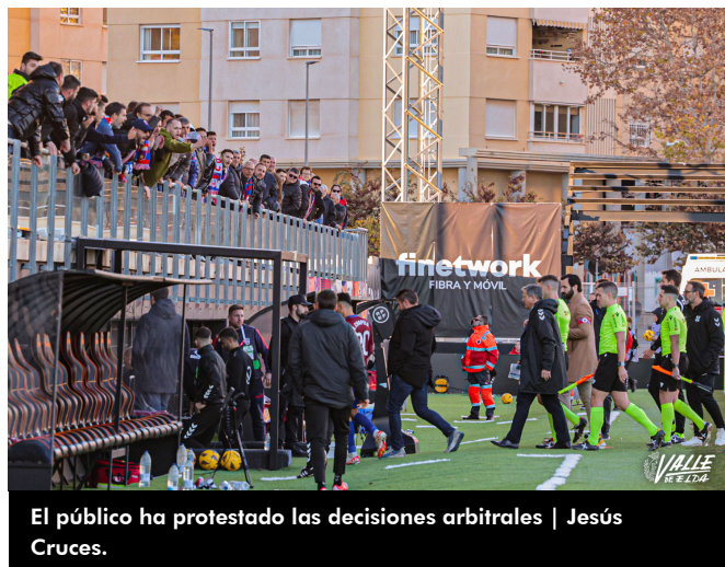
El público ha protestado las decisiones arbitrales | Jesús Cruces.

El próximo partido de los azulgranas será el miércoles 6 de diciembre a las 17 horas en La Romareda ante el Málaga en el partido correspondiente a la segunda fase de la Copa del Rey.