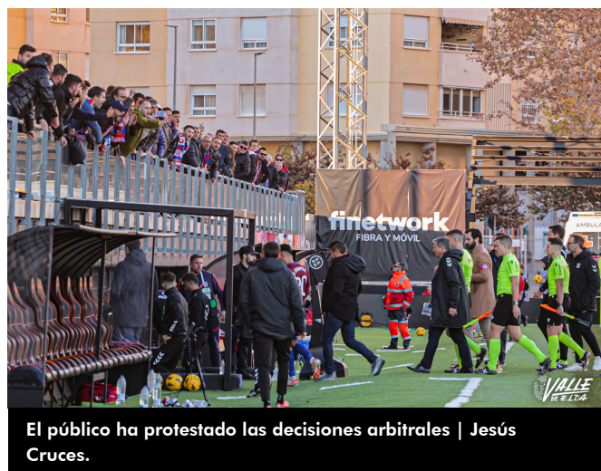
El público ha protestado las decisiones arbitrales

El próximo partido de los azulgranas será el miércoles 6 de diciembre a las 17 horas en La Romareda ante el Málaga en el partido correspondiente a la segunda fase de la Copa del Rey.