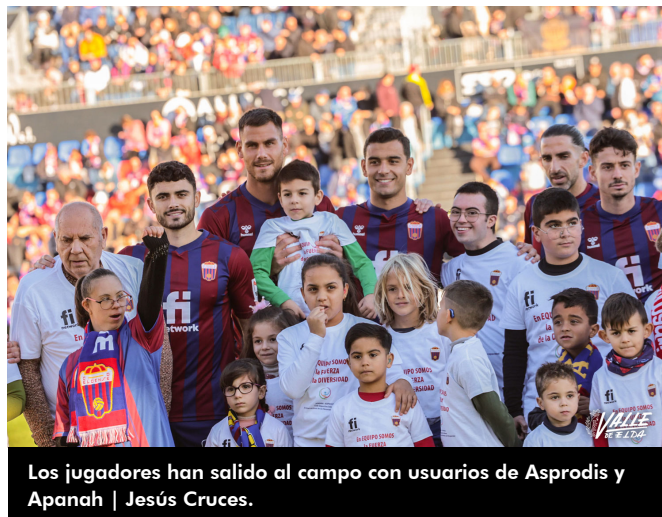
Los jugadores han salido al campo con usuarios de Asprodis y Apanah | Jesús Cruces.

igual que pasó en el partido ante el Sporting de Gijón el acierto no ha estado de cara para los azulgranas.