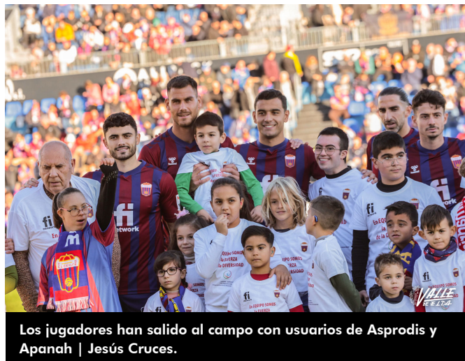
Los jugadores han salido al campo con usuarios de Asprodis y Apanah

igual que pasó en el partido ante el Sporting de Gijón el acierto no ha estado de cara para los azulgranas.