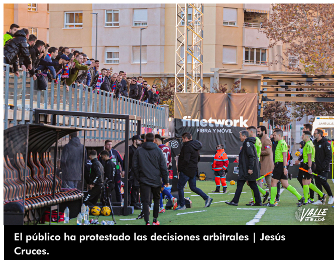
El público ha protestado las decisiones arbitrales | Jesús Cruces.

El próximo partido de los azulgranas será el miércoles 6 de diciembre a las 17 horas en La Romareda ante el Málaga en el partido correspondiente a la segunda fase de la Copa del Rey.