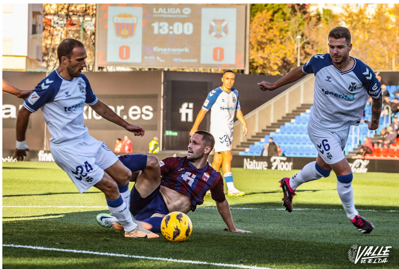
El Eldense no ha conseguido superar al Tenerife | Jesús Cruces.

Nueva derrota del CD Eldense. El Tenerife se ha impuesto por 0-3 a los azulgranas en un partido que ha estado protagonizado por las decisiones arbitrales ya que el primer gol de los isleños ha llegado por un polémico penalti que podría estar en fuera de juego. Ángel, López y Teto han sido los goleadores de la tarde. El Eldense se sitúa 12º en la clasificación con 23 puntos.