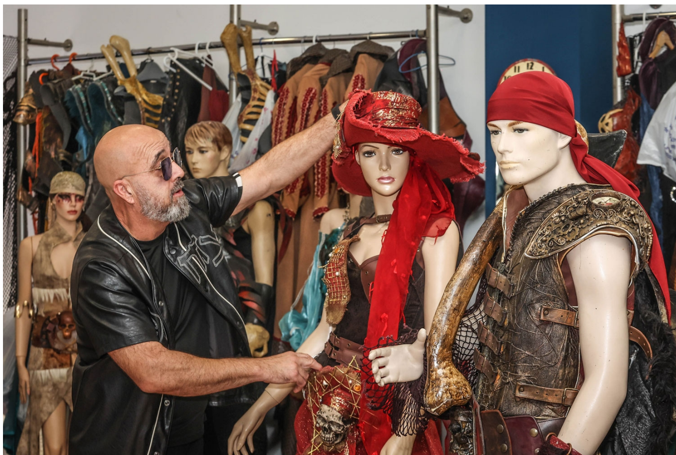
El Galeón está especializada en la comparsa de la calavera.

Pocas son las escuadras Piratas que no han lucido algunos de los espectaculares trajes de El Galeón, la tienda que alquila y diseña trajes, especializada en la comparsa de la calavera. Este negocio eldense nació hace más de 30 años con el objetivo de diferenciarse del resto de empresas del sector.