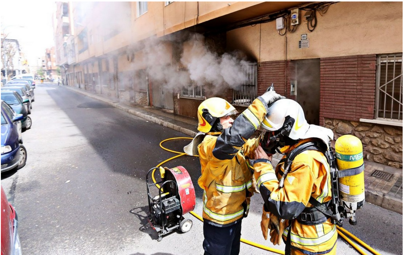
El incendio se ha iniciado en el dormitorio del entresuelo | Jesús Cruces.

Los vecinos de un edificio ubicado en la calle Poeta Zorrilla, número 87 de Elda, han sido desalojados esta mañana entre las 12:25 y las 13:25 horas, a causa de un incendio ocurrido en el entresuelo de un inmueble de cuatro plantas , habitado por un matrimonio de avanzada edad que convivía con cuatro perros y un gato.