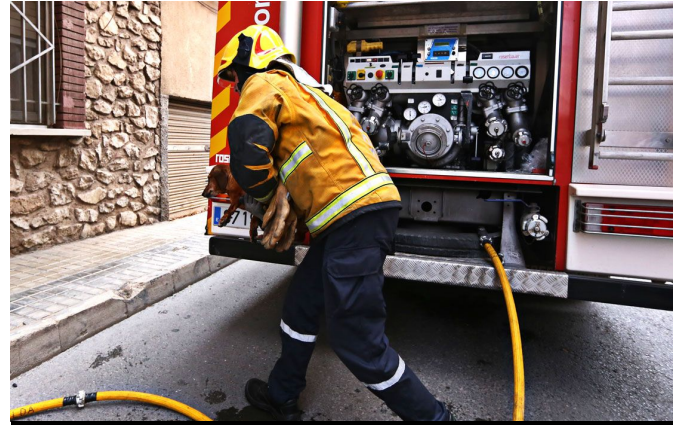
Los bomberos han salvado los animales que residían en la vivienda | Jesús Cruces.

que el incendio se ha originado en el dormitorio de la vivienda, que ha quedado completamente calcinado, además se ha quemado la instalación eléctrica y el humo se ha extendido rápidamente por toda la casa, por lo que el matrimonio no puede volver a ella, y serán los Servicios Sociales los que se harán cargo de la pareja a la espera de que acudan a recogerlos un familiar desde Valencia.