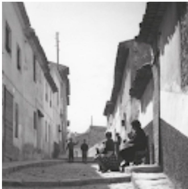
Arranque de la calle con los vecinos a la puerta de sus casas.

El Cristo, año tras año, es una fiesta muy particular para los petrerenses. Una fiesta de carácter eminentemente religioso en la que destaca la fe que todo el pueblo siente por el crucificado que aguarda la visita de los fieles en su pequeña ermita. Las fiestas siempre se han vivido de una forma especial en esta vía urbana y la alegría de las personas que habitaron en ella y la habitan siempre se ha fundido con la devoción al Cristo. Los vecinos han participado muy activamente como costaleros, han cumplido con la tradición, han apoyado con sus donativos y siempre han estado dando soporte a la mayordomía en todas sus tareas. Año tras año sigue viva la implicación, las ganas y la colaboración de los vecinos para que todo salga perfecto. Esta calle es singular porque nos conduce a un lugar muy emblemático, la ermita, donde la imagen del Cristo nos aguarda para que compartamos con él nuestras alegrías y nuestros temores. Una calle que como todas las del nuestro casco histórico hay que cuidar porque forma una parte muy importante de nuestro trazado urbano y de nuestra idiosincrasia como pueblo.