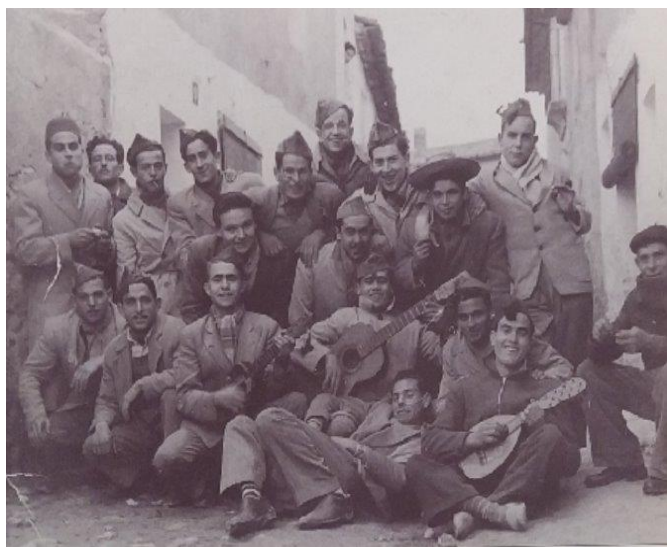
La Quinta del 53 posando en la calle del Cristo. 14-II-1954.