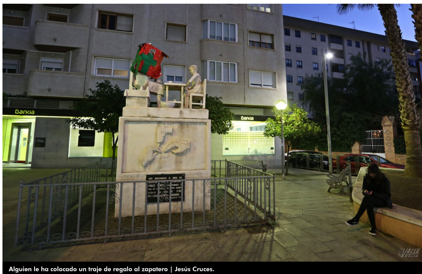
Alguien le ha colocado un traje de regalo al zapatero

Alguien ha escalado los cerca de tres metros de altura que mide la emblemática escultura de la Plaza del Zapatero para realizar un acto vandálico, pues le ha colocado un disfraz a una parte de la misma, que ha quedado tapada. El autor de este hecho no ha dudado en subirse a lo alto del monumento, del escultor Alejandro Pérez Verdú , y se desconoce si su intención era abrigar a la figura del zapatero para protegerlo del frío intenso que se está registrando en la ciudad o bien hacerla partícipe, aunque tarde, de la tradicional carrera de la San Silvestre eldense.