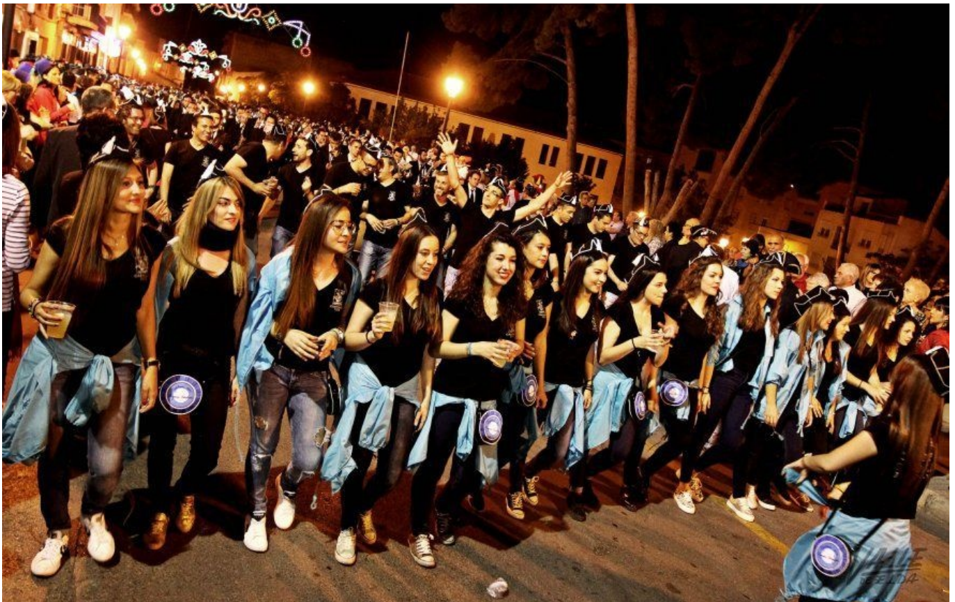
Las entraetas ponen en marcha la cuenta atrás para los Moros y Cristianos de Petrer.

Cientos de personas salieron la noche de ayer sábado a las calles de Petrer para celebrar la primera de las tradicionales Entraetas, previas a las fiestas de Moros y Cristianos de la localidad que tienen lugar del 14 al 18 de mayo.