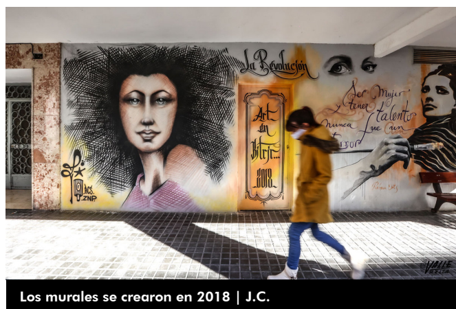
Los murales se crearon en 2018 | J.C.

Esta misma tarde, a las 19 horas, la organización de ArtenBitrir ha convocado una concentración en la zona para despedirse de los murales, habrá música fúnebre y se leerá un pequeño texto al respecto.