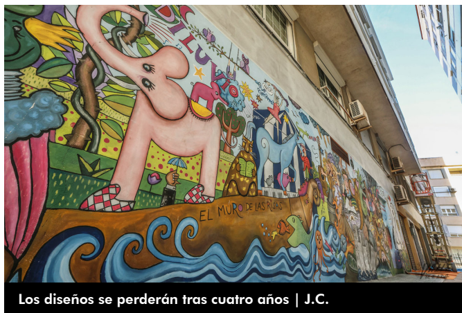
Los diseños se perderán tras cuatro años