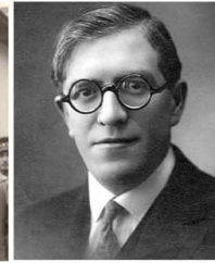
Julio Álvarez del Vayo Ministro de Estado