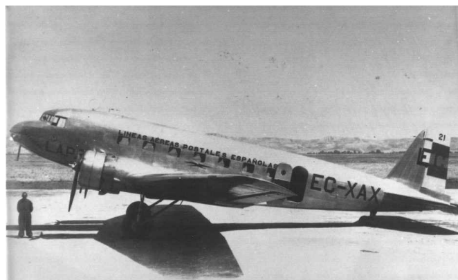
Bimotor Douglas DC-2, de las Líneas Aéreas Postales Españolas, similar a los utilizados por Juan Negrín y sus ministros en la salida del aeródromo de Monóvar.