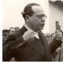
Juan Negrín López Presidente del Gobierno