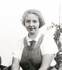
Mª Teresa León Goyri Escritora