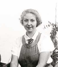
Mª Teresa León Goyri Escritora