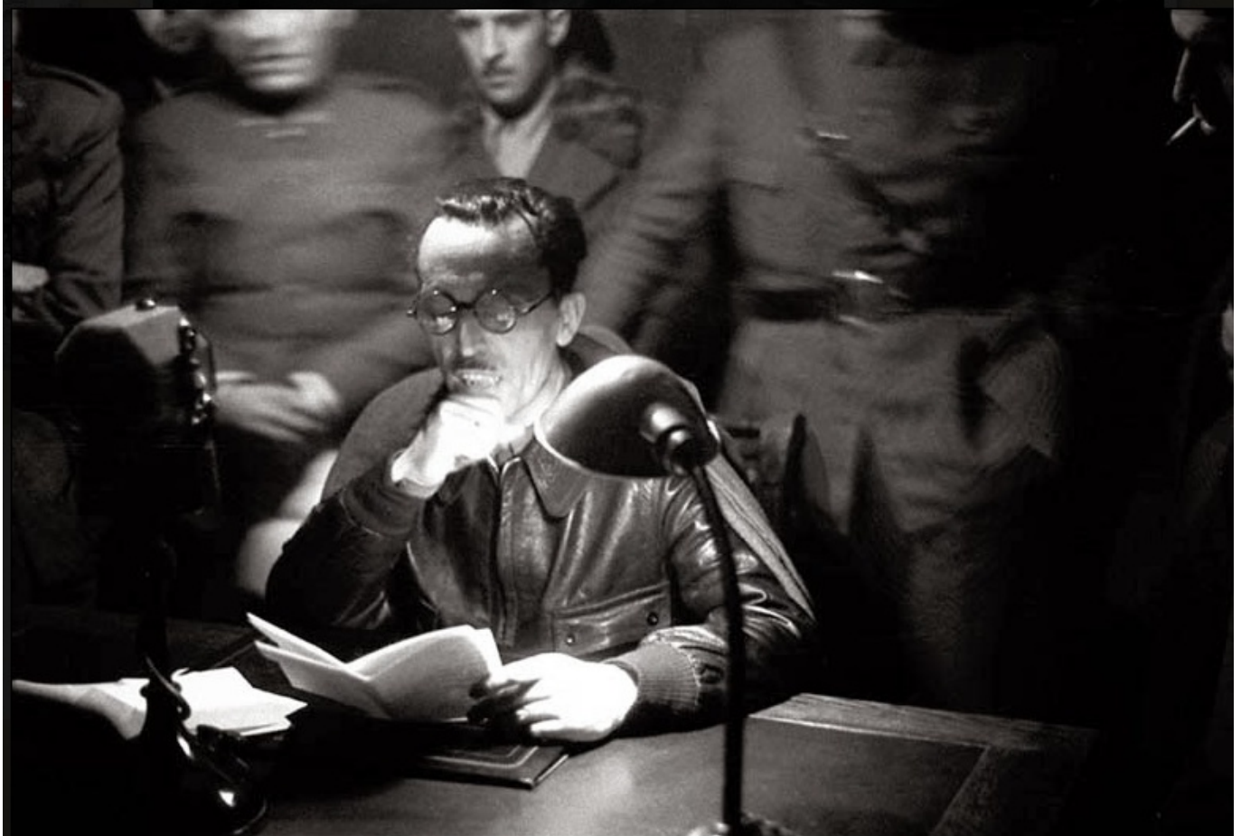
El coronel Segismundo Casado lee el 5 de marzo de 1939 su manifiesto contra Negrín en los micrófonos de Unión Radio, justificando la sublevación contra el gobierno de la República.

La sublevación del coronel Casado durante la tarde-noche del domingo 5 de marzo de 1939 contra el presidente del gobierno de la República, Juan Negrín , precipitó los acontecimientos dentro del bando republicano y obligó al presidente del gobierno, a los pocos ministros que le acompañaban y a destacados dirigentes del Partido Comunista a abandonar España. A lo largo del lunes día 6 de marzo, varios aviones, en sucesivos vuelos y a diferentes horas, despegaron desde el aeródromo del Hondón , en Monóvar , con dirección a Orán y a Toulouse.