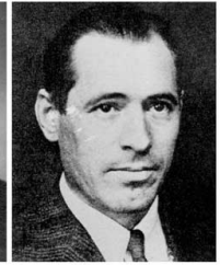
Vicente Uribe Ministro de Agricultura