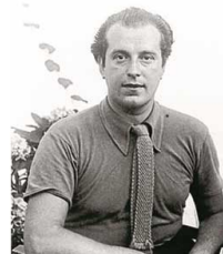
Rafael Alberti Merello Escritor