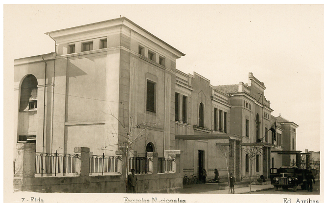
Grupo Escolar "Emilio Castelar" (act. CP. Padre Manjón), de Elda,

Al amanecer del 6 de marzo dos aviones despegaron consecutivamente desde el aeródromo de Monóvar , en la pedanía del Fondó , dirección al aeródromo de Orán , en Argelia.