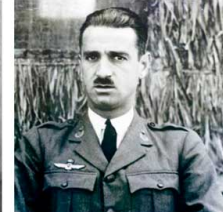
General Ignacio Hidalgo de Cisneros Jefe de la Fuerza Aérea Republicana