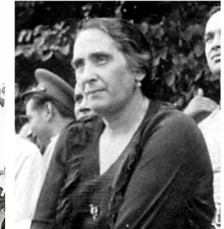
Dolores Ibárruri "Pasionaria" Dirigente del PCE