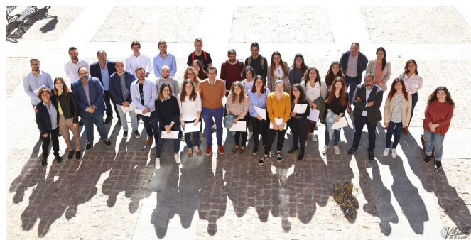
Imagen de archivo de uno de los programas de empleo

Por último, el programa Emcorp, ya activo en estos momentos, asciende a un importe de 175.581 euros cuyo programa comenzó el pasado mes de agosto y tiene una duración hasta enero 2022.