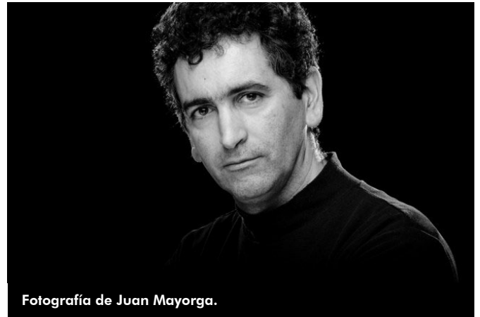
Fotografía de Juan Mayorga.

Desde sus inicios la Real Academia Española viene desarrollando su labor bajo el lema "limpia, fija y da esplendor". Nadie mejor que Juan Mayorga para engrandecer, asentar, pulir y abrillantar el idioma de Cervantes.