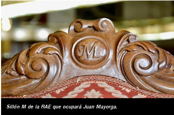
Sillón M de la RAE que ocupará Juan Mayorga.

Con influencias, según la crítica, de autores del teatro inglés (Tom Stoppard, Harold Pinter o David Hare) o de las vanguardias europeas (como Luigi Pirandello, Eugene Ionesco o Eduardo de Filippo), Juan Mayorga ha desarrollado su propio estilo y personalidad dotando de profundidad, y múltiples capas y lecturas, a sus obras y personajes.