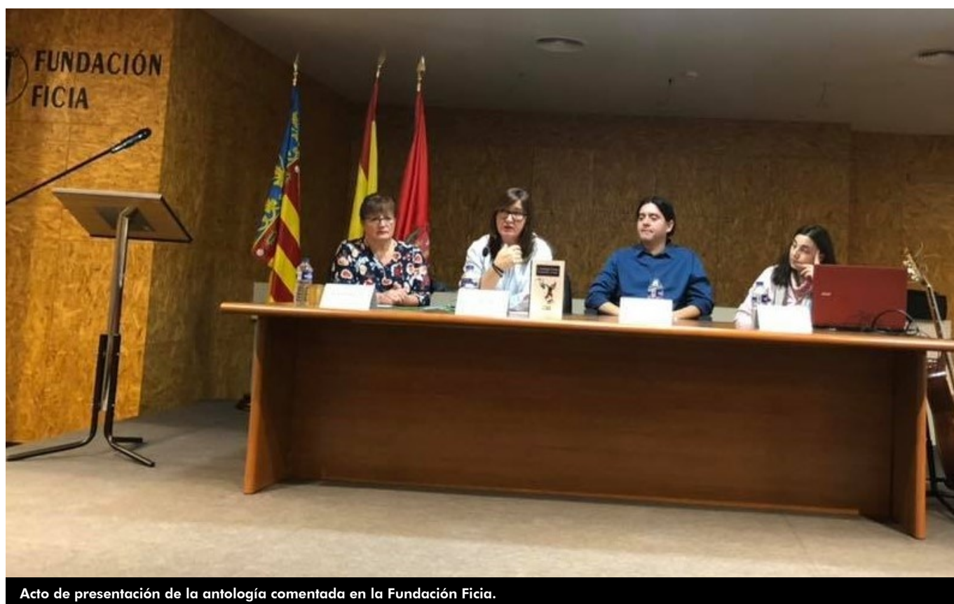
Acto de presentación de la antología comentada en la Fundación Ficia.