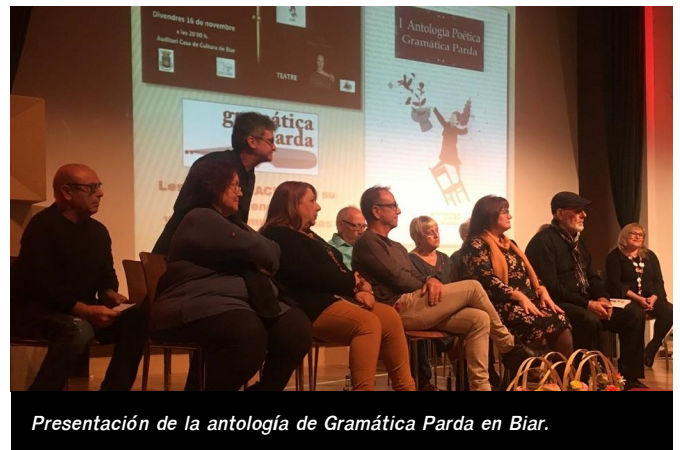
Presentación de la antología de Gramática Parda en Biar.

Acabo con la interesante reflexión final de la contraportada: “Los poemas nos rescatan de lo cotidiano y nos imbuen en sentimientos que vagan más allá del tiempo y del espacio. (...) El lector encontrará en estas páginas, no una evasión, sino noventa y tres audaces invitaciones al mundo de la fantasía” .