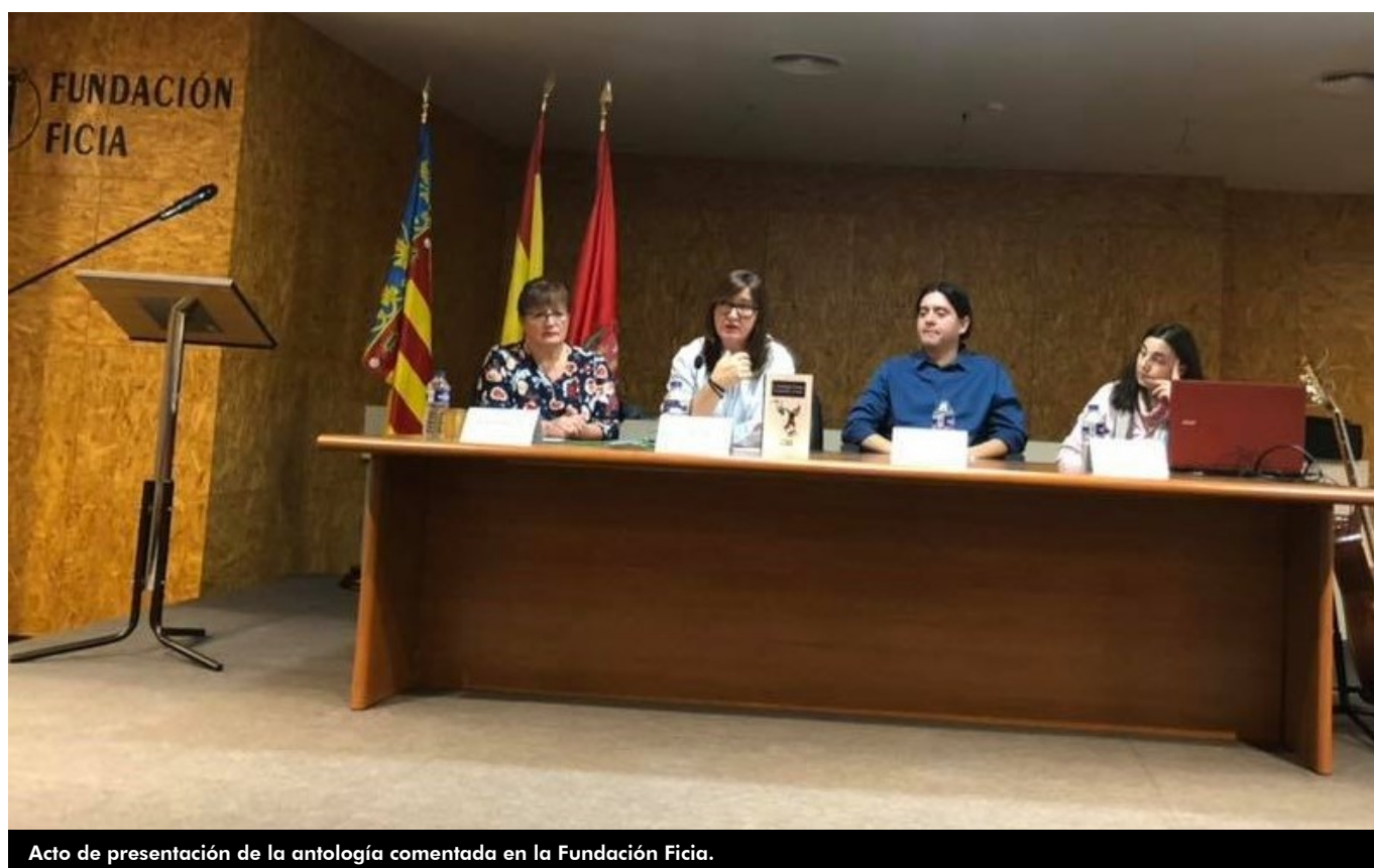
Acto de presentación de la antología comentada en la Fundación Ficia.