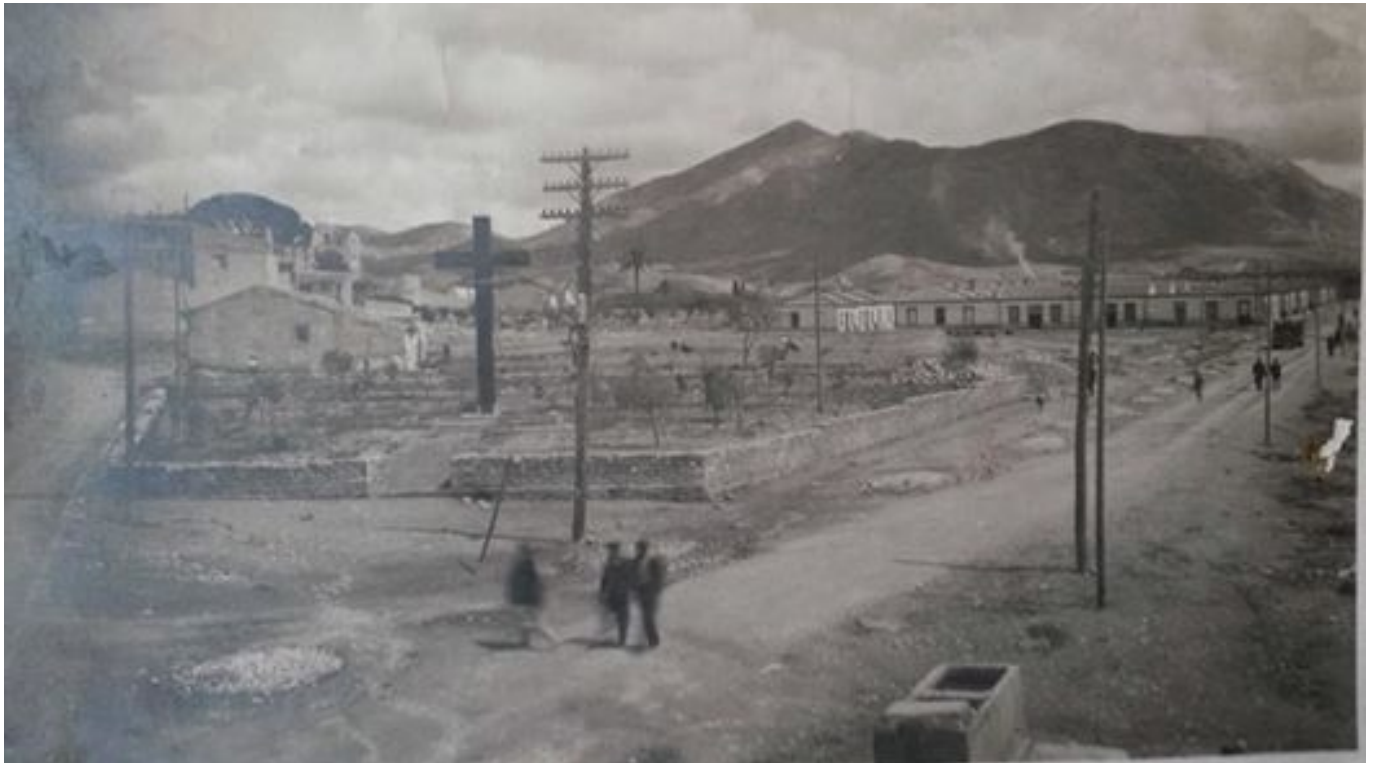
Vista del antiguo cementerio en 1939, en la que se aprecia perfectamente el perímetro que ocupó hasta su completa demolición en 1934.

Un sábado, 4 de enero de 1903 , se procedía a la clausura del antiguo cementerio municipal y a la inauguración del nuevo camposanto eldense.