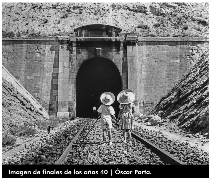
Imagen de finales de los años 40 | Óscar Porta.

Comenzó a construirse en 1855 con la excavación y concluyó tres años después. El primer viaje que pasó por el túnel aconteció el 4 de enero , y muchas personas se arremolinaron en la zona para ver cómo sobre las 12 horas llegaba desde Madrid el primer tren dirección a Alicante. En Elda hubo una parada para los viajeros, entre los que se encontraba un importante hombre de negocios, José de Salamanca y Mayol . El viaje inaugural tuvo lugar el 25 de mayo y fue realizado por la reina Isabel II y la familia real .