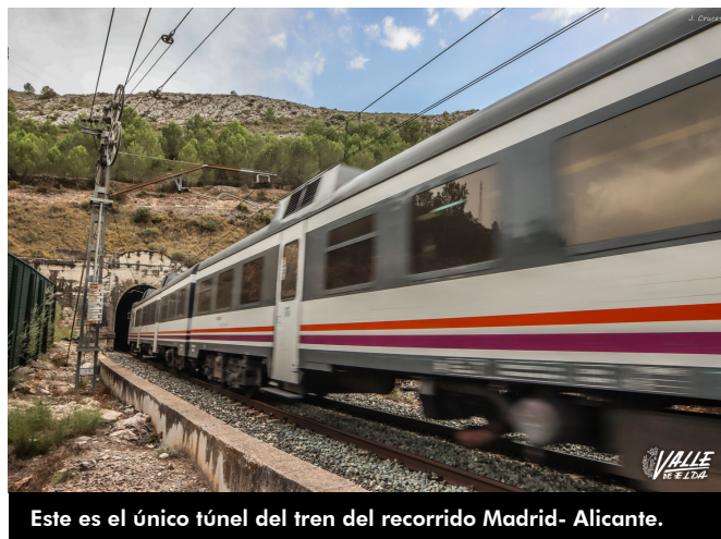
Este es el único túnel del tren del recorrido Madrid- Alicante.

Tras 165 años abriendo paso a miles de trenes, "los eldenses debemos resignarnos a que desaparezca por el tema del Corredor Mediterráneo" , señala Segura. Y es que ADIF ha anunciado que lo ampliará para adaptarlo a la vía europea .