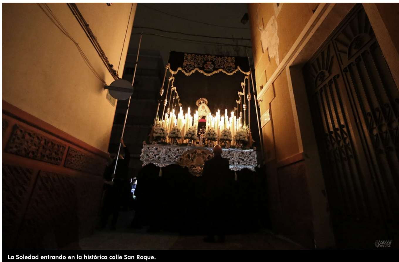
La Soledad entrando en la histórica calle San Roque.

Un imponente silencio se hizo en el casco antiguo de Elda, que quedó a oscuras, en la que sin duda es la noche más sobrecogedora de la Semana Santa eldense , la de la procesión del Silencio . La amenaza de lluvia, que finalmente respetó el acto, impidió que pudiese procesionar la imagen de Cristo del Buen Amor y lo hiciese en su lugar una imagen más pequeña de Jesús en la cruz. Así, fue la Soledad la imagen que protagonizó la procesión que recorrió por primera vez las calles del casco antiguo , solo iluminadas por la luz palpitante de las velas.