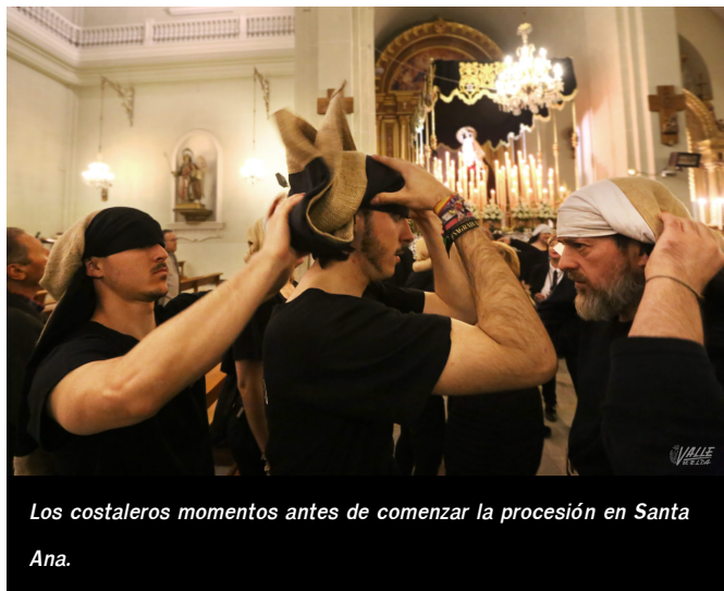
Los costaleros momentos antes de comenzar la procesión en Santa Ana.

Con el repique de las campanas de la iglesia, las puertas del templo se abrieron y en un silencio solo roto por el redoble del tambor , comenzó la procesión que contó la participación de cientos de personas iluminando el camino de la Soledad , con todas las cofradías y devotos. Este acto recrea el dolor de una madre, María, tras la muerte de su hijo, Jesús.