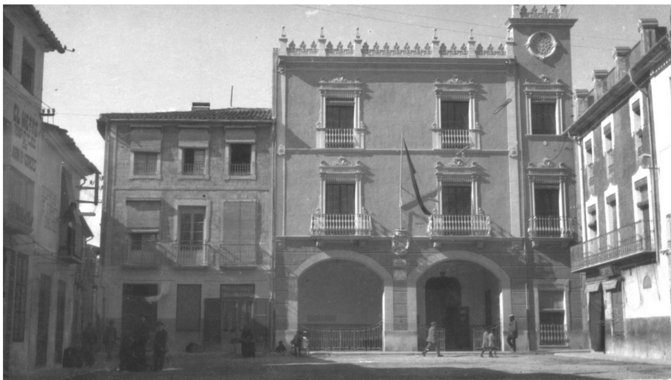
Vista de la casa consistorial eldense y de la plaza de la República.

Un lunes 13 de marzo de 1939 , a escasos 18 días del final de la Guerra Civil , el Consejo Municipal de Elda (act. Ayuntamiento) celebró la que sería la última sesión del gobierno municipal republicano antes del 1 de abril.