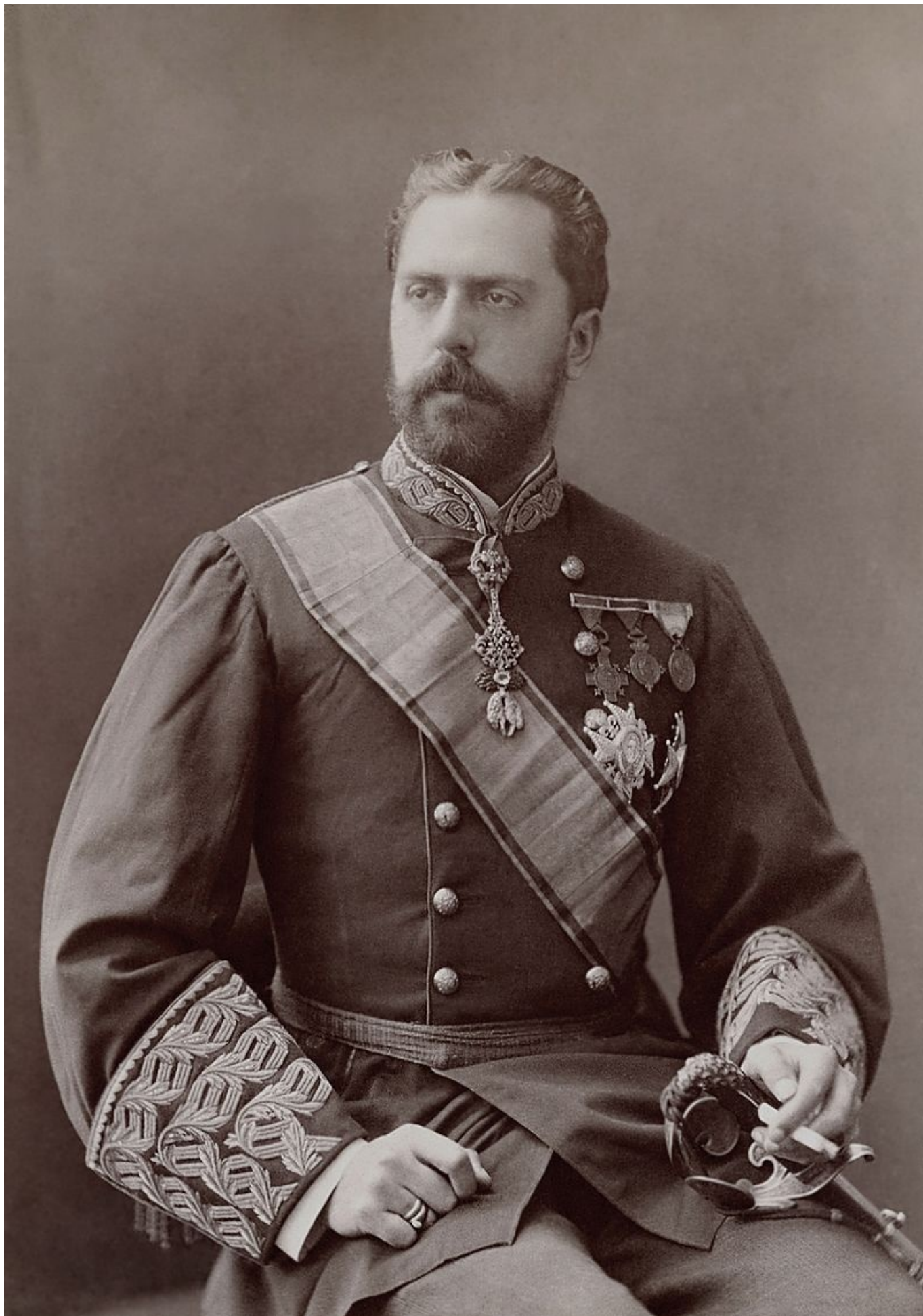
El pretendiente Carlos VII de Borbón (1848-1909).