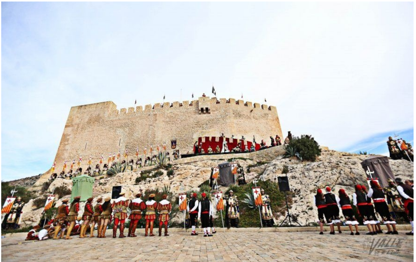
Durante la mañana el castillo ha revivido su pasado | Jesús Cruces.

Petrer ha vivido un fin de semana intenso gracias a la celebración de su "Festa del Capitans" o "Mig Any Fester", la celebración que anuncia el ecuator de los Moros y Cristianos en honor a San Bonifacio, Mártir . En el día de ayer los protagonistas fueron los capitanes de las 10 comparsas mientras que hoy ha tenido lugar la representación de la segunda parte de " La Rendició ", la recreación de la reconquista del castillo petrerense hace ya ocho siglos.