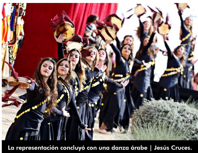
La representación concluyó con una danza árabe | Jesús Cruces.

Este recreación comenzó con el redoble de un tambor y concluyó con una danza árabe. El público asistente aplaudió el trabajo y esfuerzo de los festeros.