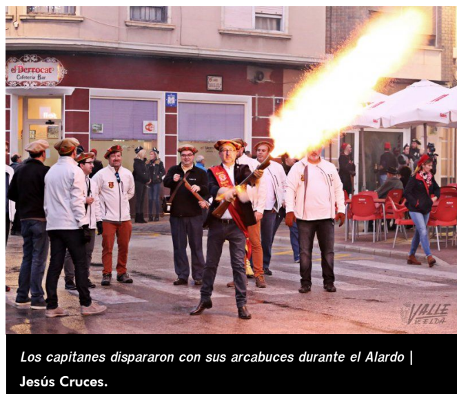
Los capitanes dispararon con sus arcabuces durante el Alardo | Jesús Cruces.

Esta celebración concluirá el próximo fin de semana: el viernes se realizará la entrega de premios del 47º Concurso de Fotografía, el sábado una cena homenaje a sus capitanes y el domingo la presentación de la película de Fiestas Moros y Cristianos Petrer 2015.