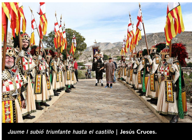
Jaume I subió triunfante hasta el castillo | Jesús Cruces.

En torno a las 13 horas, tras el pasacalles seguido por cientos de personas por el casco antiguo, primero los representantes del bando moro y después del cristiano, entraron a la Explanada del Castillo, donde se realizó la recreación. El público llenó el lugar para ver a Jaume I entrar triunfante en caballo hasta las puertas de la fortaleza , que significaba la vuelta de este pueblo a manos cristianas.