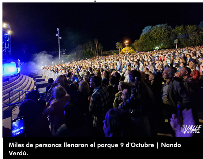
Miles de personas llenaron el parque 9 d'Octubre | Nando Verdú.

El éxito estaba asegurado incluso antes de que empezase la actuación, pues se produjo una gran cola a la entrada que daba la vuelta al gran jardín. Así comienzan los actos previos a las Fiestas Patronales, que serán del 5 al 7 de octubre y que arrancarán con el pregón de Begoña Tenés el próximo miércoles 5 de octubre a las 23 horas desde un balcón de la Plaça de Dalt.