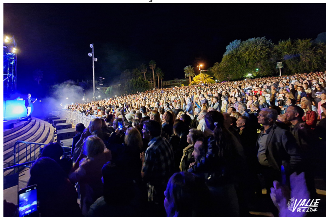
Miles de personas llenaron el parque 9 d'Octubre | Nando Verdú.

El éxito estaba asegurado incluso antes de que empezase la actuación, pues se produjo una gran cola a la entrada que daba la vuelta al gran jardín. Así comienzan los actos previos a las Fiestas Patronales, que serán del 5 al 7 de octubre y que arrancarán con el pregón de Begoña Tenés el próximo miércoles 5 de octubre a las 23 horas desde un balcón de la Plaça de Dalt.