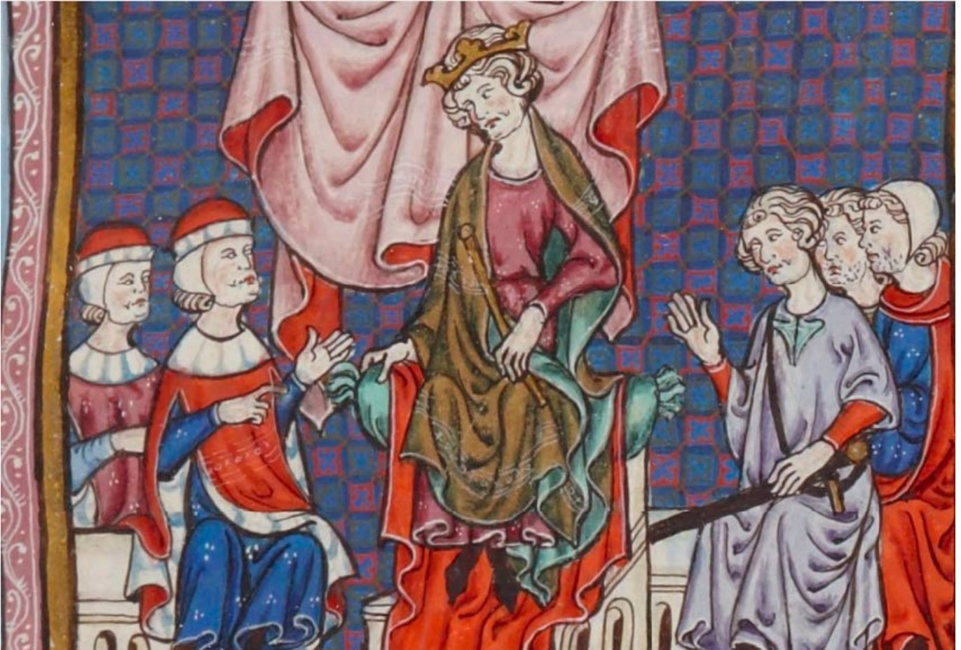
Jaime II de Aragón presidiendo un consejo real.

Un 8 de abril de 1321 , hoy hace 700 años, Jaime II de Aragón comunica a Acard de Mur, procurador del monarca aragonés en el reino de Valencia , que la torre y lugar de Salinas quedan adscritos definitivamente al término de Elda, poniendo así fin a un largo litigio originado a raíz de la conquista aragonesa del reino de Murcia en 1296 y los posteriores acuerdos de paz y reparto del reino murciano entre Castilla y Aragón.