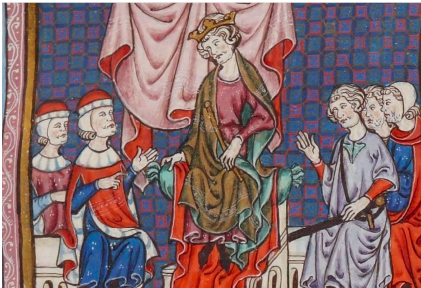
Jaime II de Aragón presidiendo un consejo real.

Un 8 de abril de 1321 , hoy hace 700 años, Jaime II de Aragón comunica a Acard de Mur, procurador del monarca aragonés en el reino de Valencia , que la torre y lugar de Salinas quedan adscritos definitivamente al término de Elda, poniendo así fin a un largo litigio originado a raíz de la conquista aragonesa del reino de Murcia en 1296 y los posteriores acuerdos de paz y reparto del reino murciano entre Castilla y Aragón.