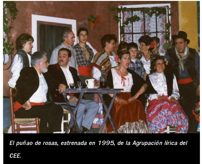
El puñao de rosas, estrenada en 1995, de la Agrupación Lírica del CEE.

2*: De Arrieta solo quedó una obra en repertorio: Marina. Estrenada como zarzuela en 1855 se amplió a ópera en 1871. Curiosamente suele figurar en las programaciones de las compañías de zarzuela, en su formato operístico.