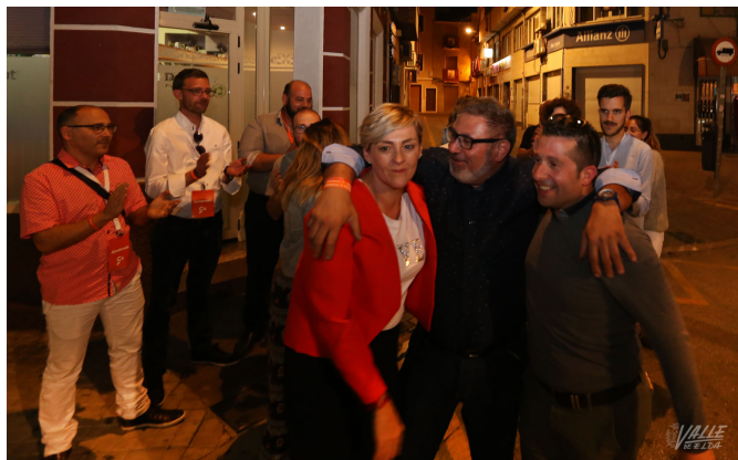
Ciudadanos se mostró contento tras haber crecido.