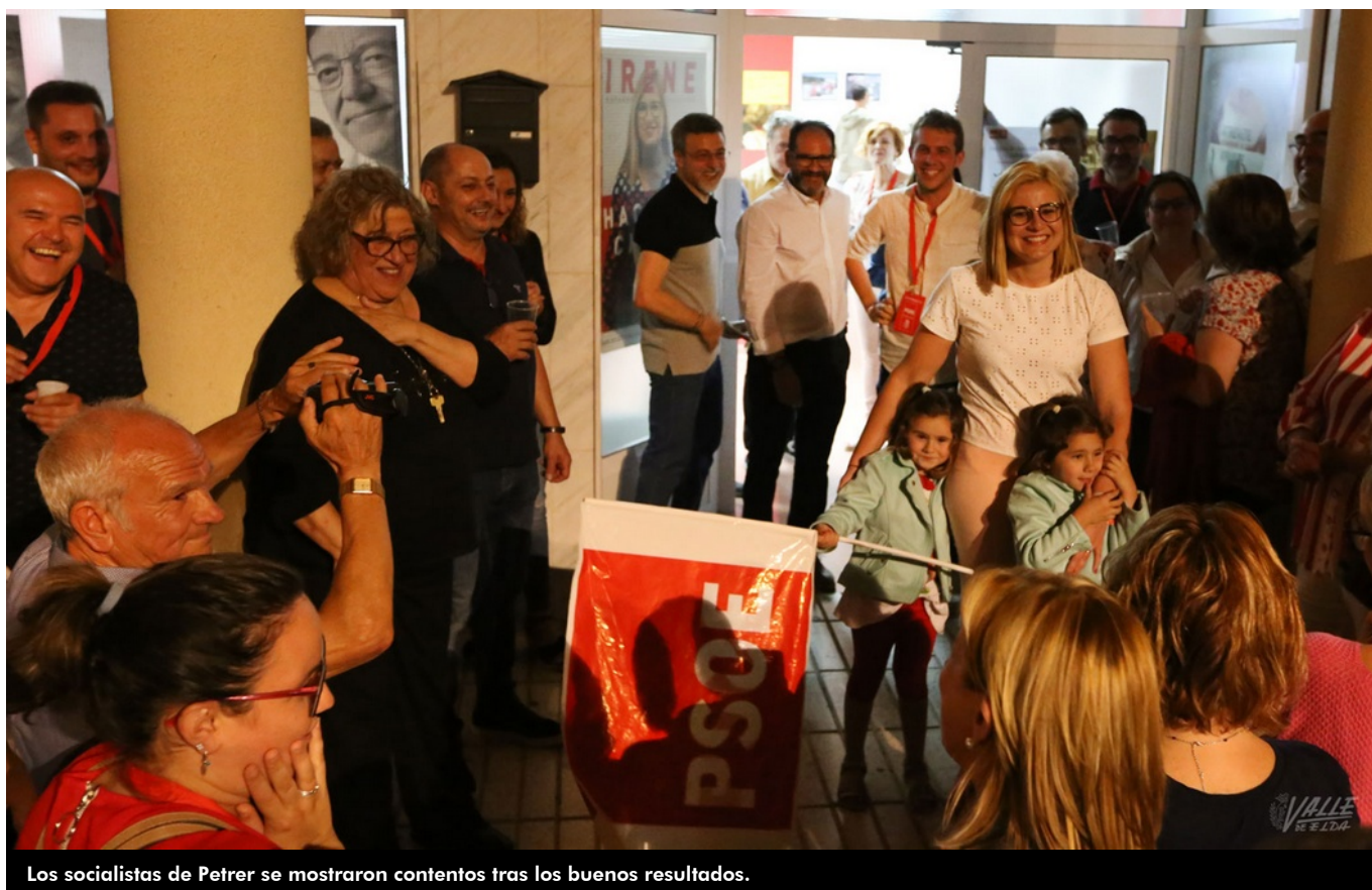
Los socialistas de Petrer se mostraron contentos tras los buenos resultados.

El PSOE arrolló anoche a la oposición en las elecciones municipales de Petrer de este 2019. Los socialistas duplicaron sus resultados en tan solo cuatro años, pasando de 4.707 votos y seis concejales en 2015 a los 8.110 y 13 concejales en las elecciones de 2019. El PP perdió su hegemonía como partido más votado en Petrer y pasa a ser la segunda fuerza con 3.346 votos y cinco concejales. Ciudadanos contará con dos concejales gracias al apoyo de 1.851 petrerenses e IU perdió uno de sus dos concejales con 1.086 votos. Se quedaron sin representación Compromís –que formaba parte del equipo de gobierno y ahora es la fuerza menos votada-, Podemos y Vox. Además la participación bajó en siete puntos , del 67,92% hasta