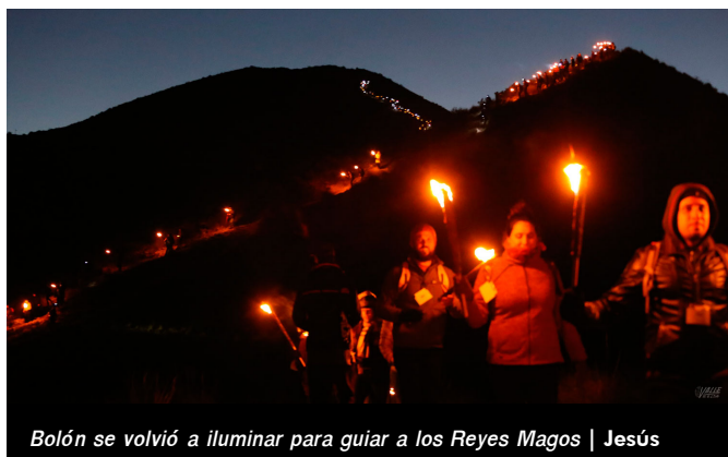
Bolón se volvió a iluminar para guiar a los Reyes Magos | Jesús

Que la tarde de Reyes este año haya caído sábado sin duda ha supuesto un aliciente para que los eldenes subiesen al monte , que contó con más visitantes que de costumbre. Durante todo el día la cima fue un ir y venir de personas , puesto que son muchos los vecinos que cada 5 de enero suben hasta la cruz, aunque bajen antes para disfrutar tranquilamente de la Cabalgata.