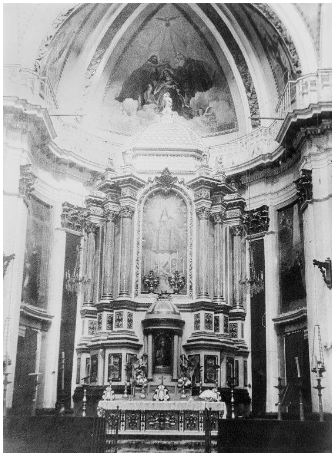
El altar antiguo de la iglesia de San Bartolomé fue destruido durante la guerra.

Nada más terminar la guerra, se optó por hacer una imagen nueva, pero no llegó a agradar a la gente del pueblo, ya que no guardaba mucha similitud con la primitiva. Por esa época fue reconstruida la imagen de la Virgen de los Desamparados de Valencia, que también había sido destruida durante la contienda. Para su reconstrucción, el maestro imaginero José M. o Ponsoda (Barcelona, 1882-Valencia, 1963) usó como base trozos de la imagen original. El resultado fue del agrado de los valencianos. Esto llegó a oídos de D. Vicente Hernández, párroco en esos años de la iglesia de San Bartolomé, el cual guardaba celosamente el busto carbonizado de la patrona, y decidió enviar dicho busto al mismo escultor valenciano, para ver si se podía llevar a cabo una buena reconstrucción. El artesano respondió afirmativamente. Tras consultar a varias personas vinculadas a la Cofradía de la Virgen y al alcalde, D. Nicolás Andreu, se decidió la restauración sin decir nada al pueblo hasta ver el trabajo realizado. Cuando trajeron la imagen a Petrer, la gente quedó satisfecha, pues en la misma sí veían reflejada a nuestra patrona la Virgen del Remedio. La imagen quedó tal como la conocemos actualmente.