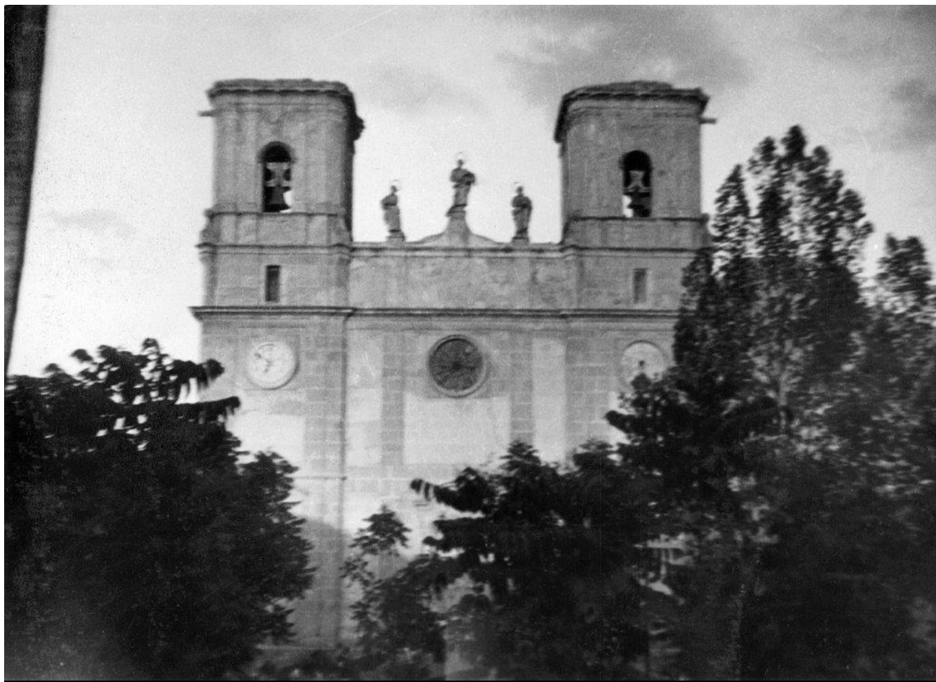
La iglesia de San Bartolomé apóstol en mayo de 1935.