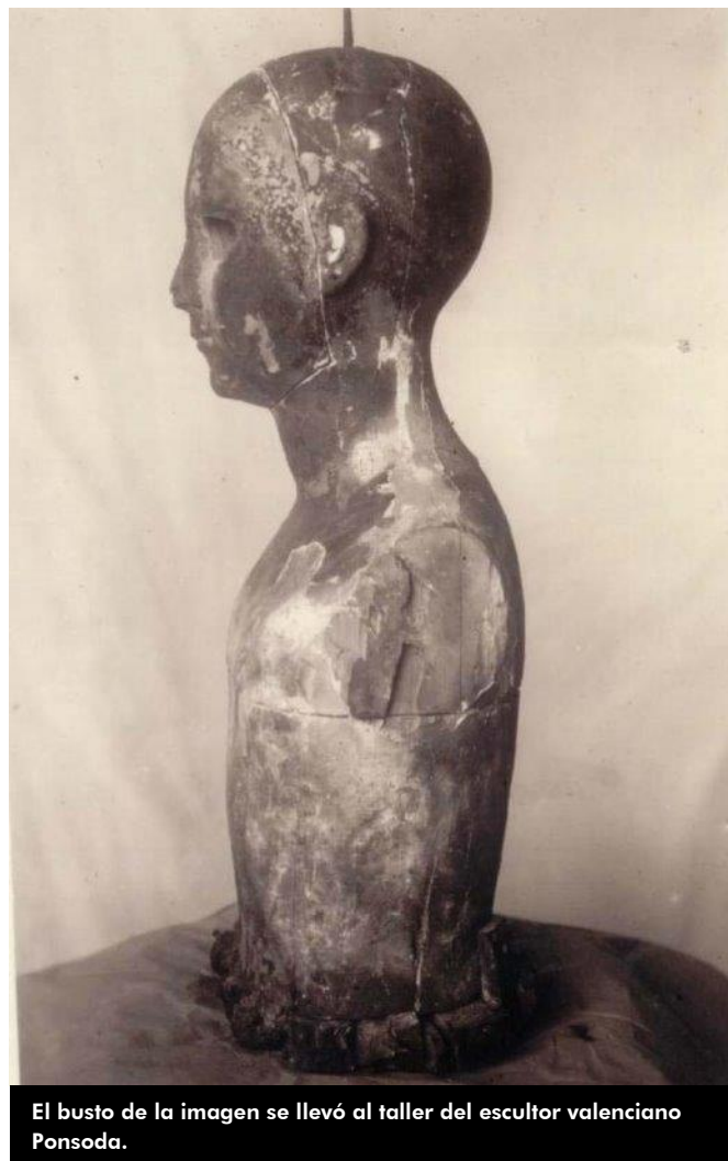
El busto de la imagen se llevó al taller del escultor valenciano Ponsoda.

directrices del gobierno de la República prohibiendo el asalto y quema de edificios religiosos, así como el expolio de joyas, objetos litúrgicos, archivos y obras de arte en ellos contenidos por formar parte del patrimonio histórico de España.