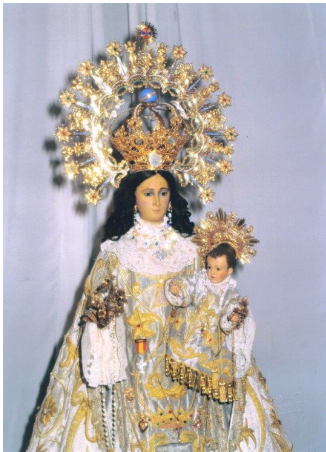
La Virgen del Remedio fue restaurada por el artista imaginero afincado en Valencia, José M.º Ponsoda | Luis Poveda Galiano.

Si os apetece saber más sobre la imagen de la Virgen del Remedio y sobre cómo fue la bendición del templo tras su restauración, cómo tuvo lugar la adquisición y la bendición del resto de las imágenes que se conservan en