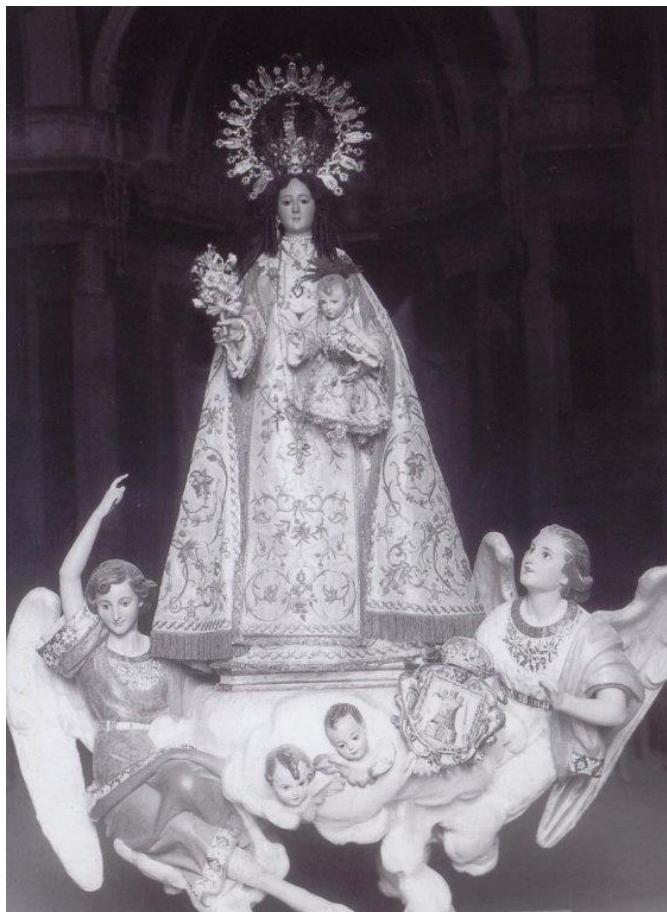
Imagen de la Virgen del Remedio durante la celebración del tercer centenario. Año 1930.