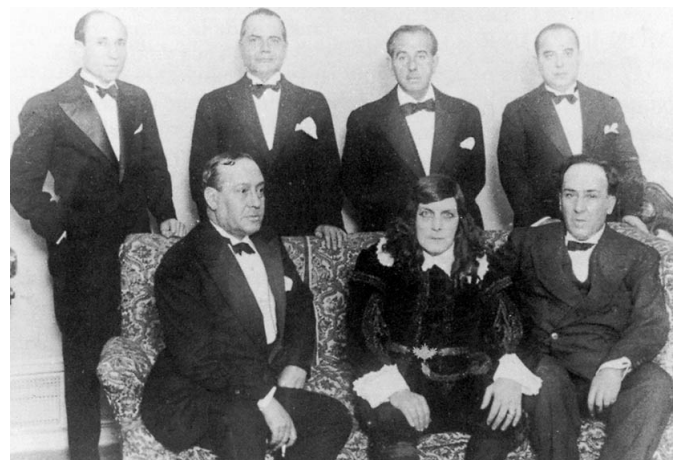
Manuel Machado, el actor Ricardo Calvo y Antonio Machado, sentados, en diciembre de 1929 tras el éxito de La Lola se va a los puertos .

y Los complementarios , por su lenguaje sentencioso, sobrio, emotivo y reflexivo a un tiempo, y donde la sencillez y el enfoque didáctico predominan , podrían considerarse tales. Como escribe Joaquín Marco, en el prólogo a su excelente selección en Canciones y aforismos del caminante , su prosa "nunca abandona la ironía como recurso, el distanciamiento y, a la vez, la pasión en la defensa de lo que se dice" . Esa es su mayor fuerza, toda una lección de estilo simplemente magistral. Y si el pensamiento, cultivado de una forma asistemática en su obra, será esencial en Machado para desentrañar el camino del vivir, la consistencia del arte o la heterogeneidad del ser, Marco no duda en afirmar que estamos ante "uno de los modelos más originales del ensayo contemporáneo".