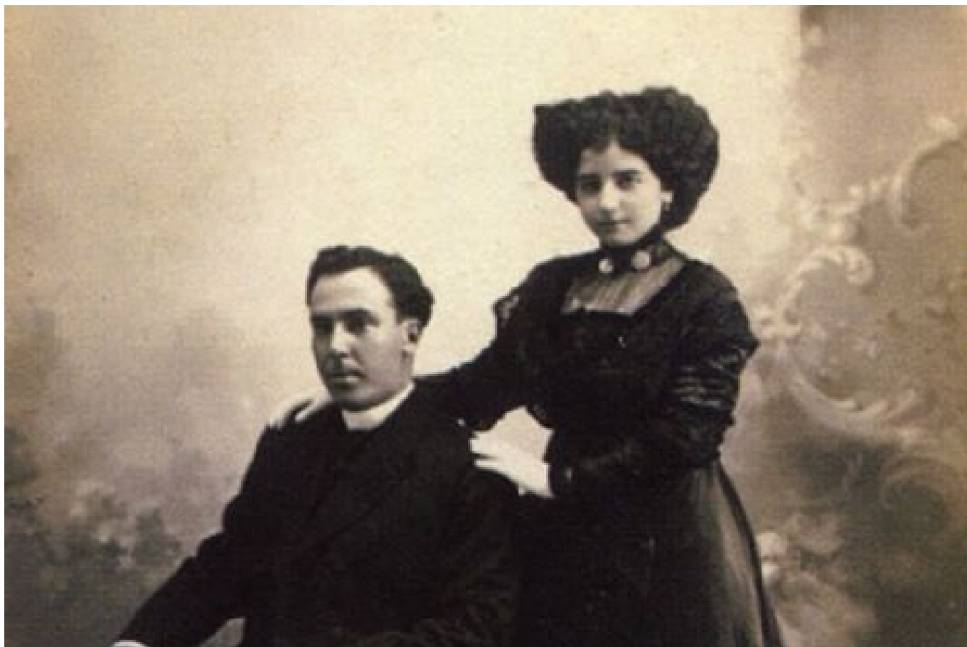
Antonio Machado y Leonor Izquierdo, el día de su boda, el 30 de julio de 1909.