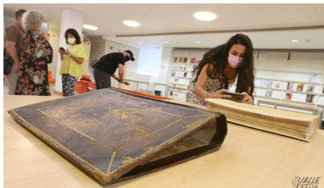
La restauración ha durado cinco meses.