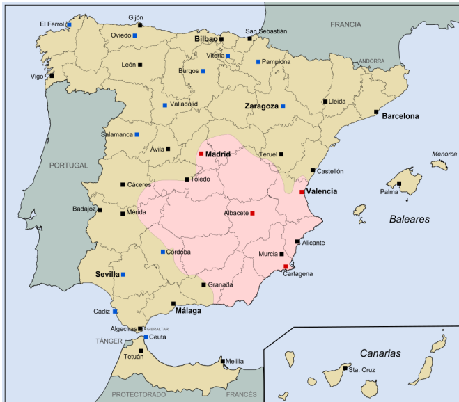
España en febrero de 1939 después de la caída de Cataluña.

El día 28 se supo por radio que Madrid había caído en manos del ejército franquista. Momento en el cual empezó a actuar la quinta columna y el Socorro Blanco, aunque sin hacer alardes ni manifestaciones para evitar choques violentos. El día 29 de marzo aparecieron colgaduras blancas en la entonces calle Buenaventura Durruti (actual Jardines), por donde transitaba la carretera nacional N-330, que conforme avanzaba el día fueron sustituidas por la bandera roja y gualda.