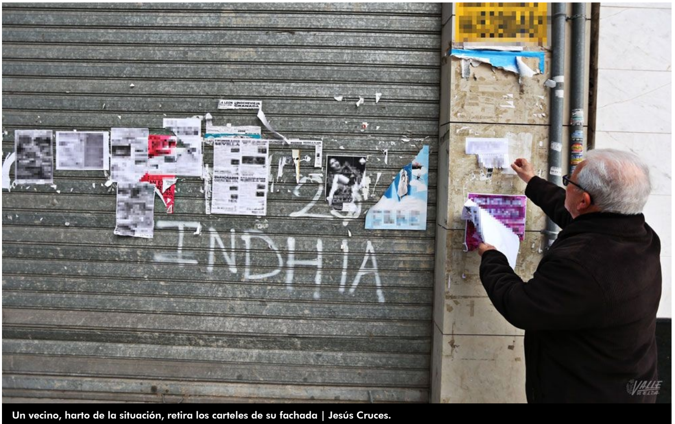
Un vecino, harto de la situación, retira los carteles de su fachada | Jesús Cruces.

Ante la proliferación de cartelería pegada en fachadas, farolas, casas y solares abandonados, incluso en obras en construcción, por toda la ciudad, desde la Concejalía de Mantenimiento de la Ciudad comunica a la población que de acuerdo con la Ordenanza de Limpieza Pública, según reza en su artículo 36, queda prohibida "la colocación y pegado de carteles y adhesivos fuera de los espacios reservados a tal fin" .