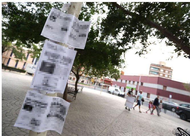
Farola llena de carteles en el interior del parque de la Concordia | Jesús Cruces.

Gómez ha advertido que la ordenanza de limpieza tiene 17 años y está obsoleta , de hecho su propio texto resulta incoherente en algunos puntos, por lo que cree que habría que actualizar dicha Ordenanza de Limpieza Pública , a la vez que se debe hacer una campaña para concienciar a la población con el propósito de que la gente no coloque indiscriminadamente carteles por cualquier punto de la ciudad, ya que produce una imagen negativa y de falta de limpieza . De hecho -ha dicho- "estamos actuando por los barrios con limpiezas de choque en farolas, jardines o papeleras y la próxima semana lo haremos en el barrio Estación, y así hasta llegar a todos los barrios".