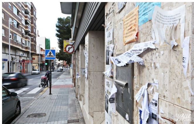
Una de las fachadas de Jaime Balmes | Jesús Cruces.

Valle de Elda ha efectuado un recorrido por la ciudad para comprobar cómo la gente hace uso de los espacios públicos para pegar sus carteles y anuncios, y durante los últimos días estos aparecen pegados en todo tipo de fachadas de edificaciones, tanto públicas como privadas, sitios en los que hay incluso carteles anunciadores de actividades municipales.