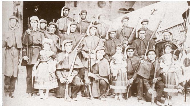
La fiesta de Petrer estuvo presente en el recibimiento de la reina. En la imagen la Comparsa Vizcaínos en el año 1864.

Torreta, disponiéndose a ambos lados de la vía para saludar a la familia real. Allí, los eldenses habían levantado un arco triunfal , a modo de arquitectura efímera, decorado con ramas verdes de taráis, flores y banderas nacionales.