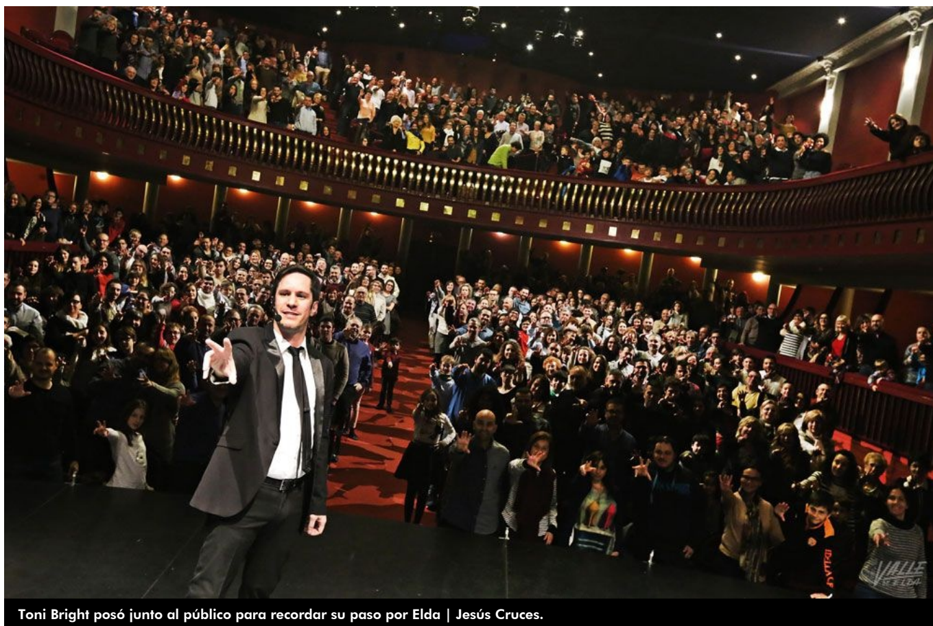
Toni Bright posó junto al público para recordar su paso por Elda | Jesús Cruces.

El Teatro Castelar se llenó al completo ayer para disfrutar de un espectáculo repleto de magia, Volver a creer. La magia de la mente de Toni Bright, uno de los mejores mentalistas del momento. El público fue el gran protagonista de la noche , pues a lo largo de todo el espectáculo este mago de la mente subió a más de una decena de personas al escenario y contó con la colaboración de muchos más desde sus asientos.