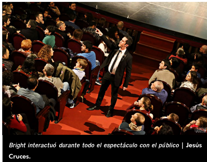
Bright interactuó durante todo el espectáculo con el público | Jesús Cruces.

conseguido llevar a cabo todas las pruebas , pues tanto niños como adultos quedaron asombrados por el talento de Bright.