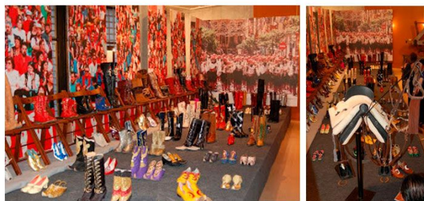
Exposición de zapatos de Moros y Cristianos en el Museo del Calzado (26 de abril de 2007).

Pero esa no es la única relación del Museo y las Fiestas de Moros y Cristianos . Sus salas han servido para exponer actividades organizadas por varias comparsas: exposiciones de indumentarias o muestras de dibujos relacionados con la fiesta. También las diferentes capitanías expusieron sus zapatos en las salas del museo.