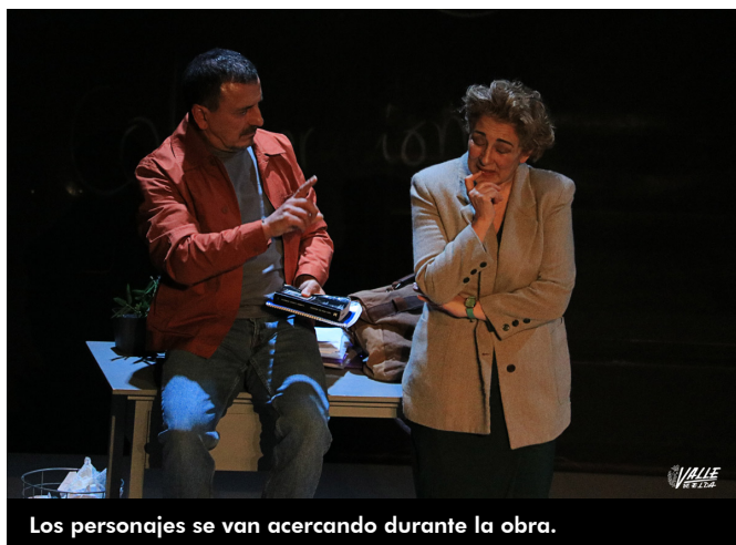
Los personajes se van acercando durante la obra.

A lo largo de la historia se desgrana que los graves conflictos que sufre Daniela en el instituto son, en realidad, problemas secundarios a los que se enfrenta la chica, de los que sale con la ayuda de su padre y su profesora. El padre hace todo lo que puede por su hija, mientras que ella se convierte en un gran apoyo para la menor. Estos personajes sienten una demoledora soledad, y a lo largo del proceso de ayudar a Daniela, ambos se van acercando, mostrando sus complejidades y miedos