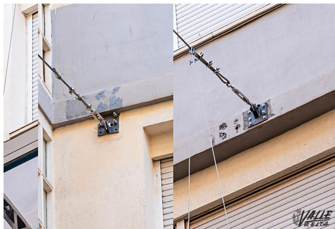
En algunos puntos se instaló y desplazó posteriormente | Nando Verdú.

tienen la estructura junto a la ventana".