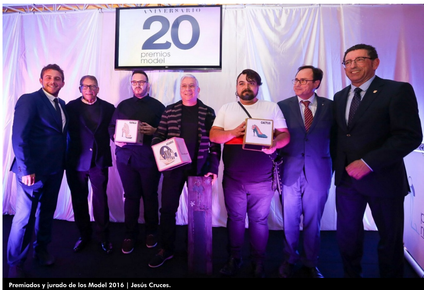
Premiados y jurado de los Model 2016