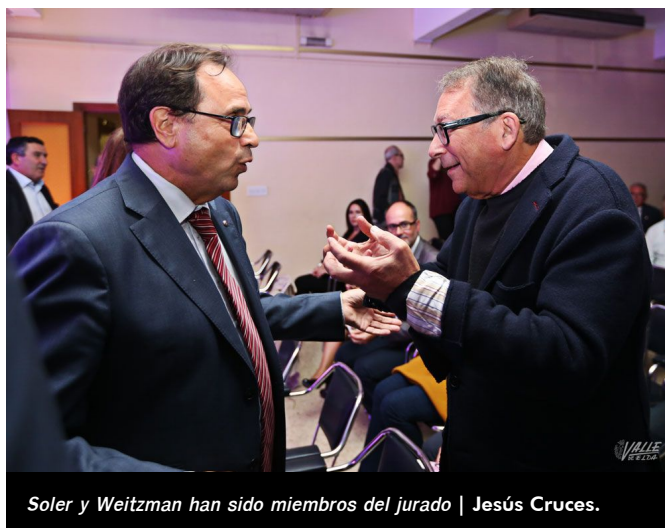
Soler y Weitzman han sido miembros del jurado | Jesús Cruces.

El acto contó con la narración de la historia de la historia industrial petrelense de la mano de una de las actividades turísticas más seguidas de la localidad, Petrer se viste de luna . Cuatro personajes subieron al escenario para contar en primera persona cómo se inició la industria del calzado en Petrer y cómo fue evolucionando a lo largo de los últimos 100 años hasta la actualidad.