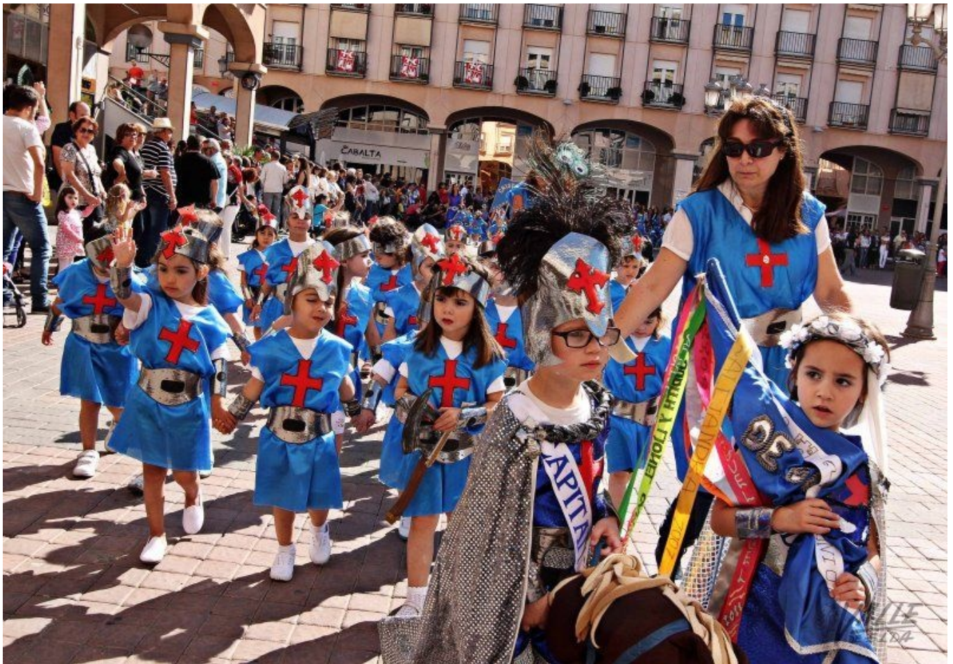
Comparsa cristiana del colegio Padre Manjón | Jesús Cruces

Unos 300 alumnos del colegio público Padre Manjón han participado esta mañana en su particular desfile de Moros y Cristianos y en la posterior Embajada Cristiana que han hecho en el propio centro. En este acto participan los niños de Infantil de los cursos de tres, cuatro y cinco años.