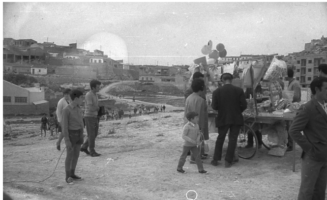
Carrito en la zona de La Foia, bajada desde Altico y calle Merendero. Posiblemente un día de Pascua, el carrito se situó estratégicamente en el camino en dirección a la Horteta.

Cacahuets, torrats , avellanas, tramussos, pipas, chufas, habas secas o hervidas, castañas asadas, llenaban los cucuruchos de papel de estraza, unas veces y, otras, o la mayoría de papel de periódico.