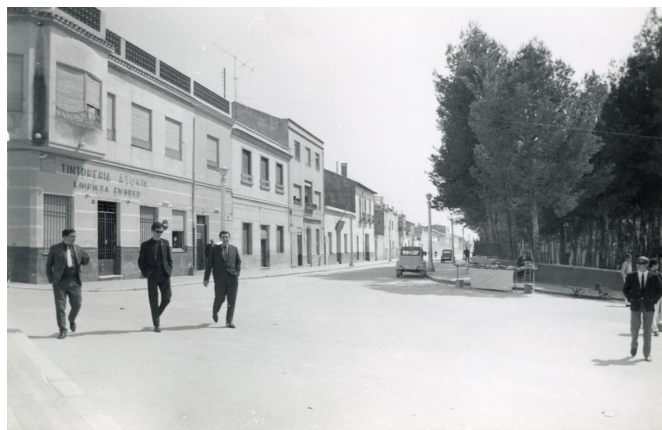
Los puestos callejeros hacían las delicias de grandes y pequeños, calle Leopoldo Pardines