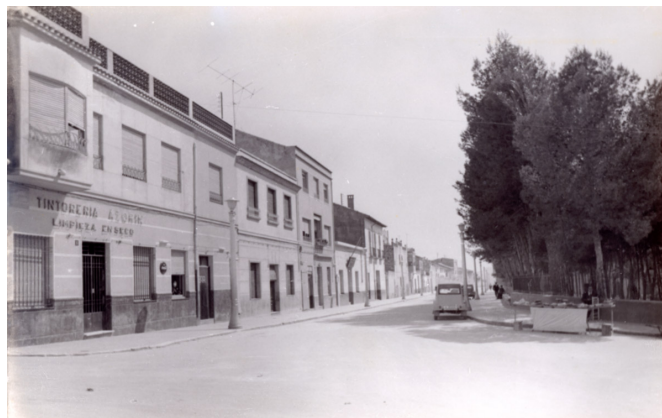
Puesto de cascaruja en la intersección del Paseo de la Explanada con la calle Leopoldo Pardines.