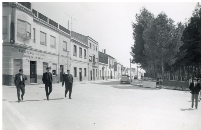
Los puestos callejeros hacían las delicias de grandes y pequeños, calle Leopoldo Pardines