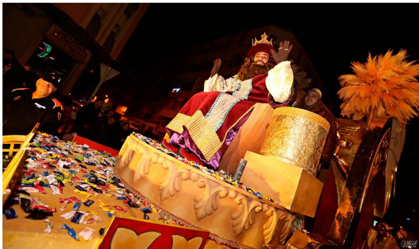
Los Reyes Magos saludaron a los petrerenses desde sus carrozas | Jesús Cruces.

Los Reyes Magos llegaron a Petrer anoche siguiendo el fuego de tradicional encendido de fallas a lo largo del casco antiguo. Este año la participación se ha multiplicado , dejando una bonita estampa desde lo alto del castillo hasta la calles del recorrido de la Cabalgata. La alegría era patente en la cara de los más pequeños , quienes esperaban con nervios y ganas la llegada de sus Majestades de Oriente . Y la Cabalgata no defraudó, los petrerenses vivieron una noche única gracias a una vistosa puesta en escena que disfrutaron miles de personas.