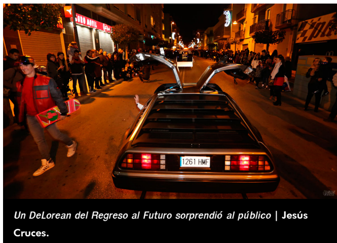
Un DeLorean del Regreso al Futuro sorprendió al público | Jesús Cruces.

Tras el bloque de fantasía y magia tomó el relevo el bloque tradicional en el que se pudo ver una gran estrella, a los pastores, a los romanos y al belén viviente, para cerrar la Cabalgata los tres séquitos reales. El fuego también estuvo presente a través de las antorchas que iluminaban el paso de los Reyes Magos. En esta cabalgata no participaron animales.