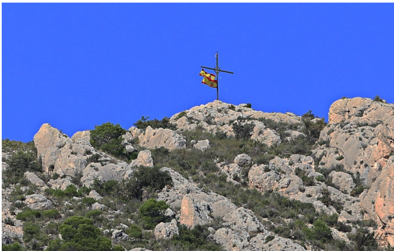
La cruz de Bolón ha amanecido con dos banderas | Jesús Cruces.

Con las primeras luces del día aquellos eldenses que hayan mirado a Bolón se habrán llevado una sorpresa. Hasta lo más alto del monte han llegado los ecos de la crisis de Cataluña, pues alguien subió durante la pasada noche hasta la cima y ha colgado de la icónica cruz dos banderas de España.