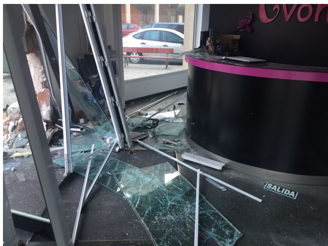
El coche ha destrozado el establecimiento.

El vehículo circulaba a alta velocidad por la avenida de Madrid en dirección hacia el instituto Azorín y ha