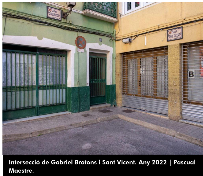
Intersecció de Gabriel Brotons i Sant Vicent. Any 2022 | Pascual Maestre.

cara de vergüenza, pero dudamos así sea y conste que no puede alegar ignorancia".