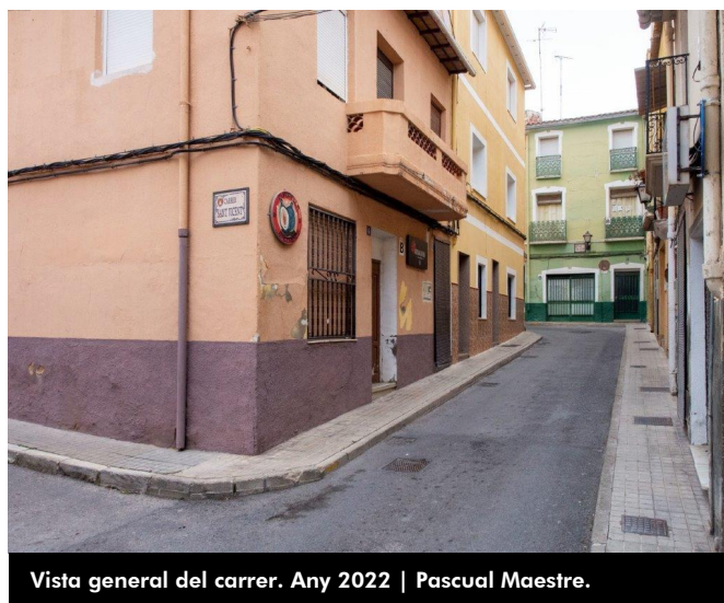
Vista general del carrer. Any 2022 | Pascual Maestre.

la de Cassoles, Fini la Morena, Maruja la de Pedro, Pepi la Fardacha, Lola la del Parao i Rosa mantenen molt bona relació de veïnatge, s'ajuden en tot el que poden i estan pendents les unes de les altres. En l'estiu ixen a prendre la fresca en el racó que forma la confluència d'este carrer amb Gabriel Brotons. També, els dies de Carasses s'ajunten obsequiant amb café, pastes, roses i mistela a tots els que passen per allí. Participen i col·laboren de manera activa i decidida en les diverses activitats que organitza l'associació de veïns Miguel Hernández, la del barri antic.