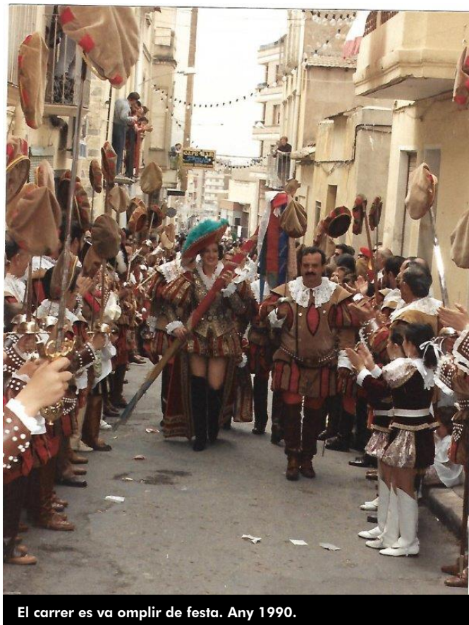
El carrer es va omplir de festa. Any 1990.