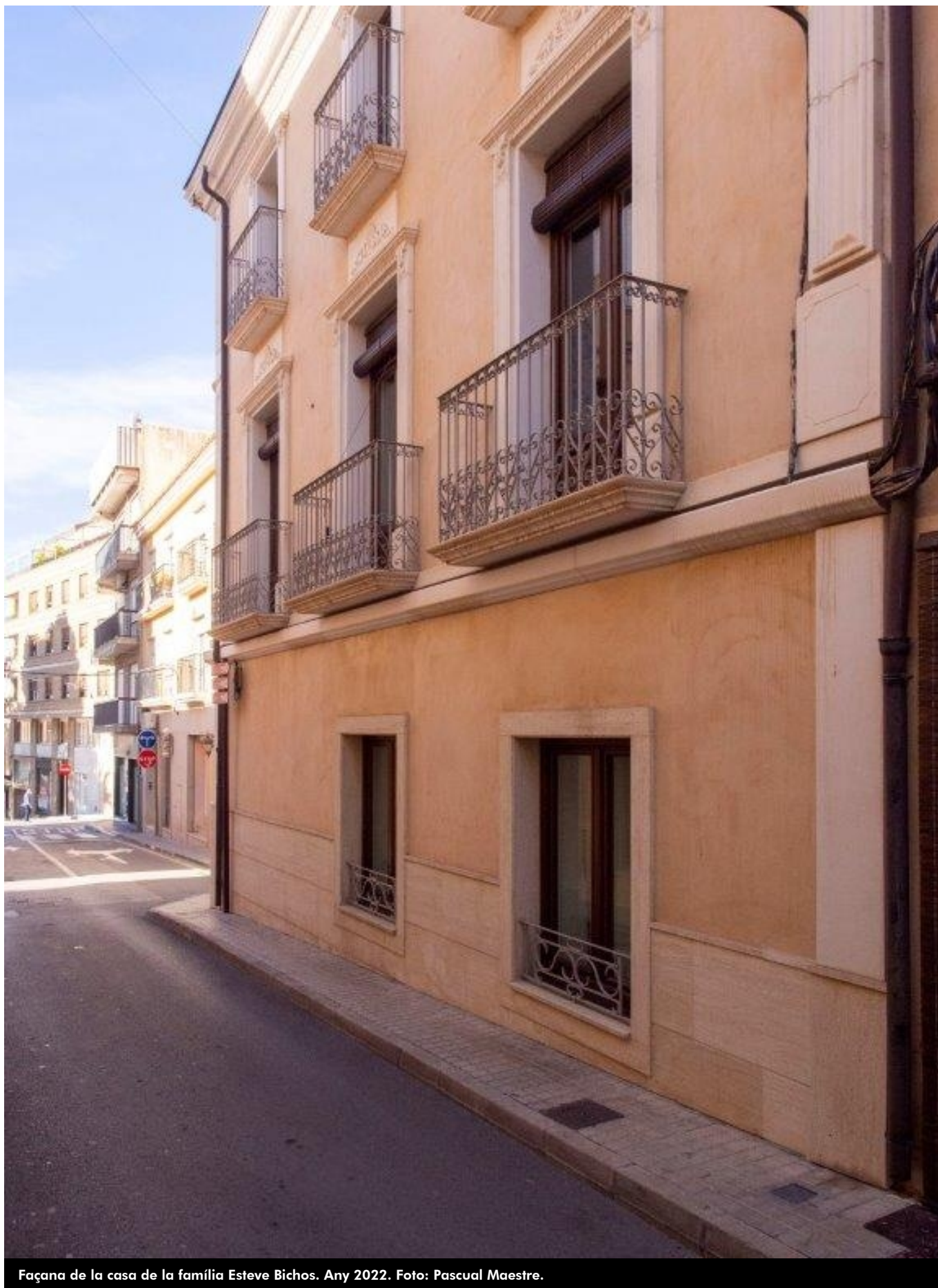
Façana de la casa de la família Esteve Bichos. Any 2022.