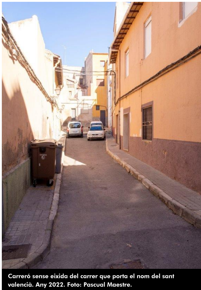
Carreró sense eixida del carrer que porta el nom del sant valencià. Any 2022.