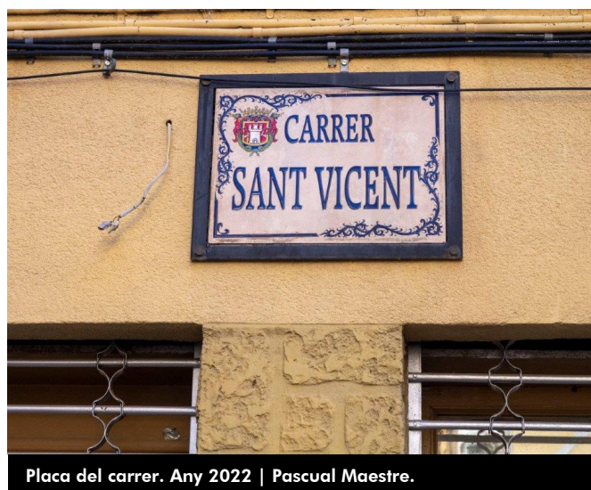
Placa del carrer. Any 2022

El carrer deu el seu nom actual a sant Vicent Ferrer, amb festivitat en l'octava de Pasqua de Resurrecció. Vicent Ferrer, dominic i predicador, va nèixer a València en 1350 i va morir a Vannes (França) en 1419. Va donar suport a Pedro de Luna, que més tard seria papa d'Avinyó amb el nom de Benet XIII. En 1412, interrompent la seua labor missionera, que l'havia portat a recórrer tota Espanya, a més de França, Flandes, Itàlia i Suïssa, va actuar en el Compromís de Casp, on va influir perquè la corona de Castella passara a les mans d'un Trastàmara, Fernando d'Antequera. Els seus dots d'orador sagrat van ser molt populars en el seu temps i sempre s'expressava en valencià. Canonitzat en 1455, la seua festa se celebra el 5 d'abril.