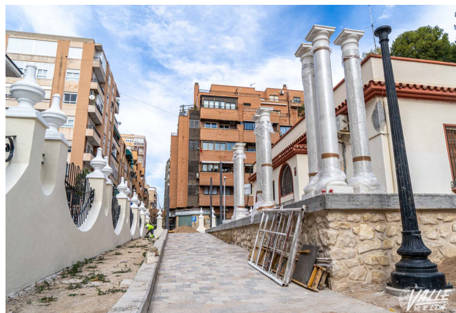
Los trabajos avanzan a buen ritmo | Nando Verdú.

En la reforma también se incluye la renovación de la iluminación LED de todo el jardín, del mobiliario urbano y la inclusión de las zonas de juegos infantiles. Además, se recuperará la actual pajarera y se ha rehabilitado todo el vallado perimetral, icónico para este jardín.