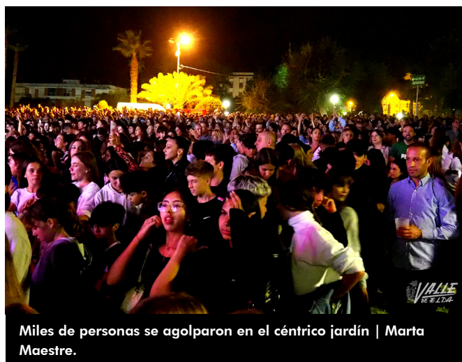
Miles de personas se agolparon en el céntrico jardín | Marta Maestre.

Por el escenario del parque pasaron hasta 15 artistas, todos ellos con el mismo objetivo, hacer disfrutar durante siete horas al público que bailó y disfrutó cada actuación.