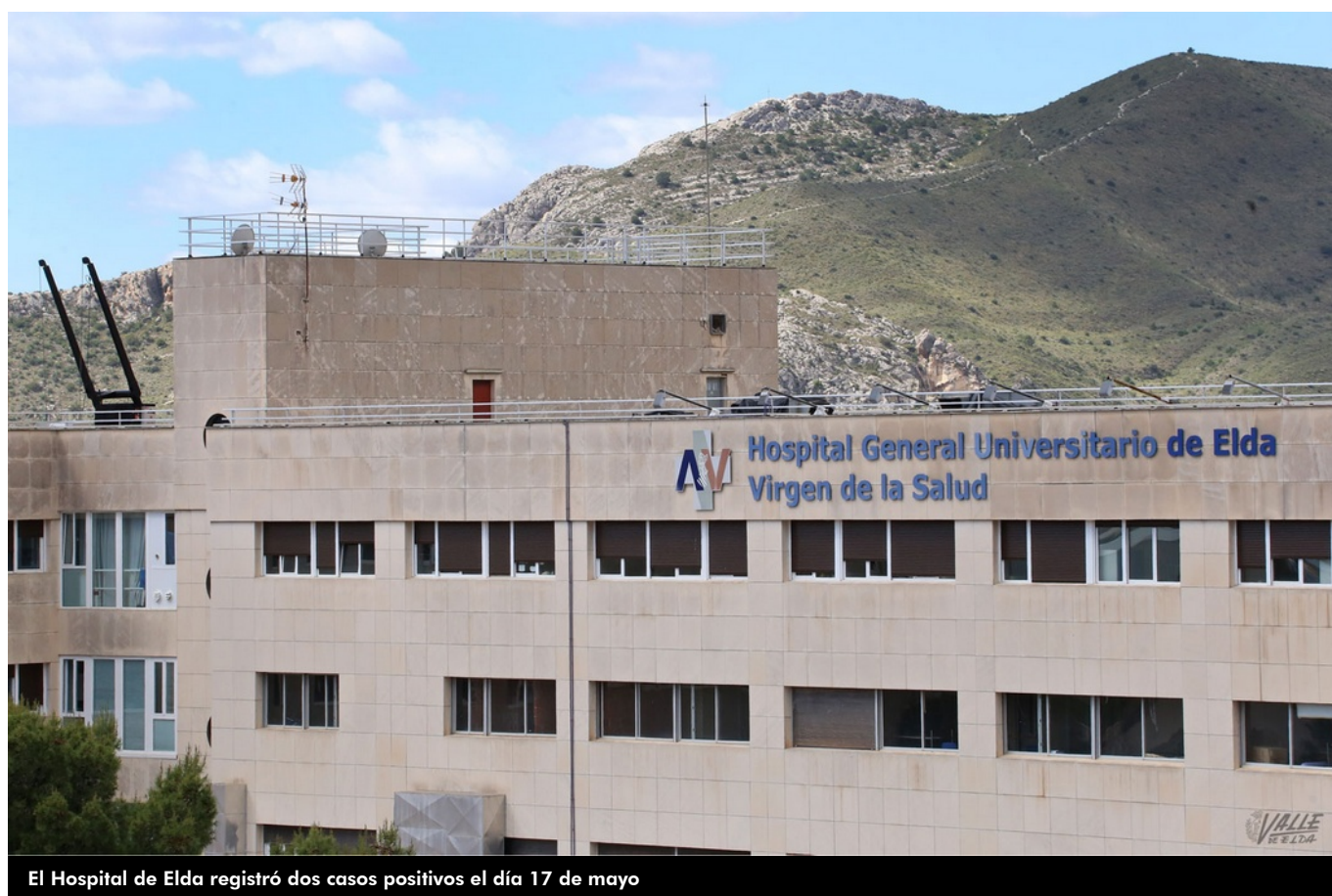
El Hospital de Elda registró dos casos positivos el día 17 de mayo

El Hospital General de Elda sumó dos positivos ayer día 17 de mayo . El Departamento de Salud cuenta con un total de 656 contagiados desde que hay registros . En cuanto a las víctimas mortales, por octavo día consecutivo no hay que lamentar fallecimientos por lo que se mantiene en 53 el número de personas que han perdido la vida debido al virus de la COVID-19.