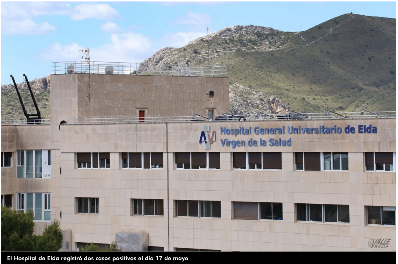
El Hospital de Elda registró dos casos positivos el día 17 de mayo

El Hospital General de Elda sumó dos positivos ayer día 17 de mayo . El Departamento de Salud cuenta con un total de 656 contagiados desde que hay registros . En cuanto a las víctimas mortales, por octavo día consecutivo no hay que lamentar fallecimientos por lo que se mantiene en 53 el número de personas que han perdido la vida debido al virus de la COVID-19.