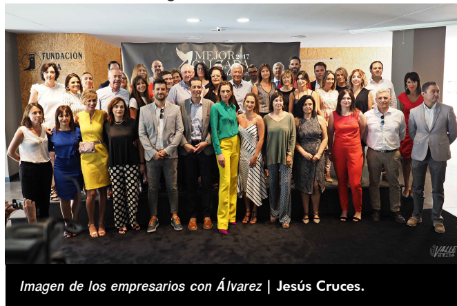
Imagen de los empresarios con Álvarez | Jesús Cruces.

que se compró en París cuando era una desconocida y soñaba con ser una gran modelo, unos Manolo Blahnik.