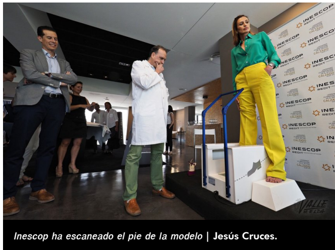
Inescop ha escaneado el pie de la modelo | Jesús Cruces.

Esta supermodelo, con 25 años de carrera, ha visitado al fin una fábrica de calzado y se ha mostrado muy interesada por cómo se creaban “las joyas que calzamos” , asegurando que para ella los zapatos son sinónimo de calidad.