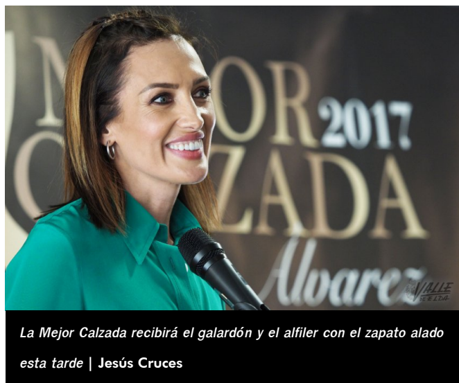
La Mejor Calzada recibirá el galardón y el alfiler con el zapato alado esta tarde | Jesús Cruces

Esta tarde continuará la celebración del día de la Mejor Calzada de España con una gala en el Teatro Castelar a las 20:30 horas. Este es un acto abierto al público previa invitación.