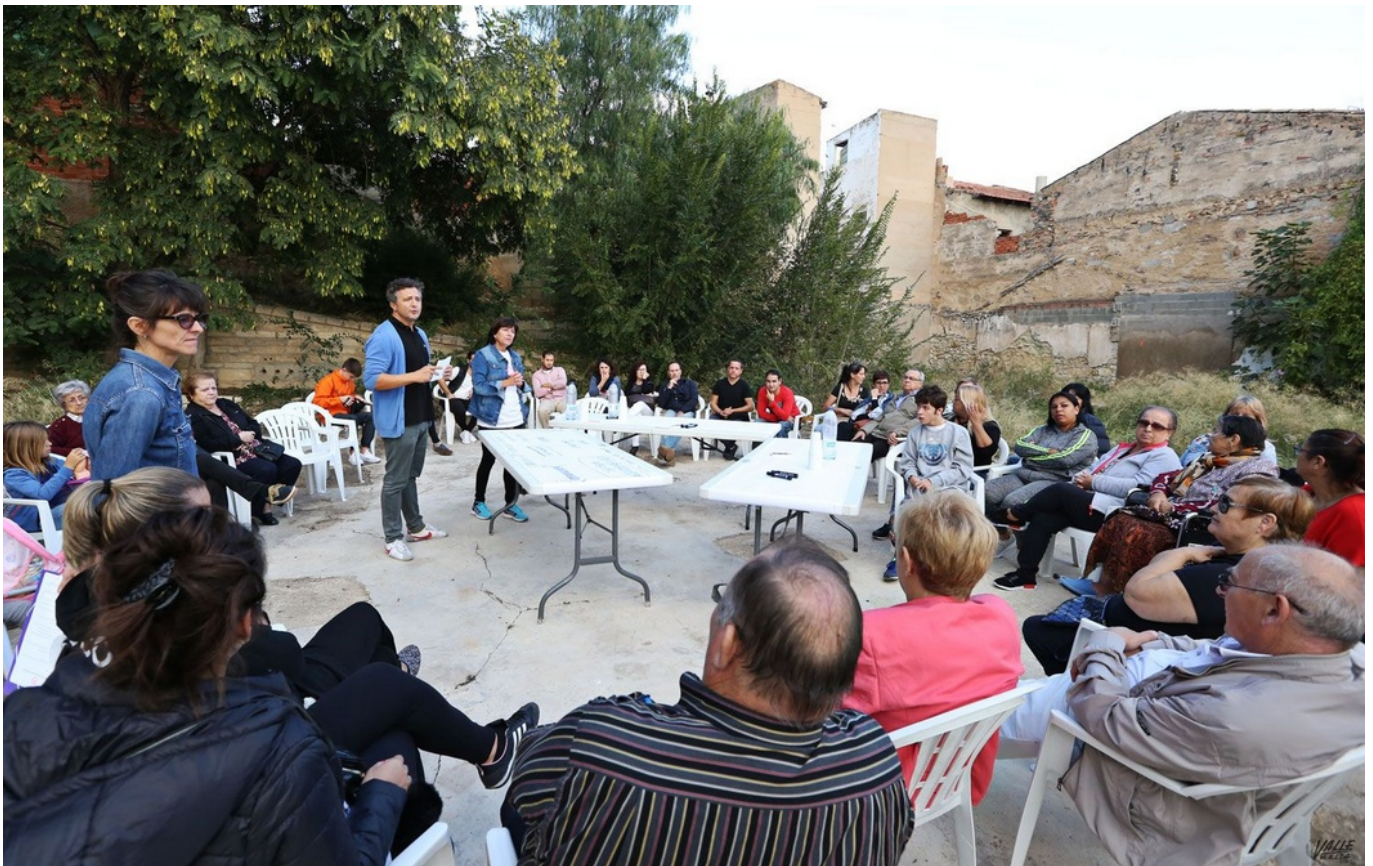
Un reducido grupo de personas acudieron al llamamiento del Ayuntamiento