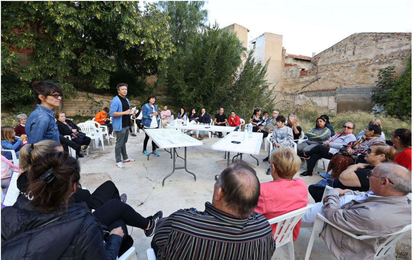
Un reducido grupo de personas acudieron al llamamiento del Ayuntamiento